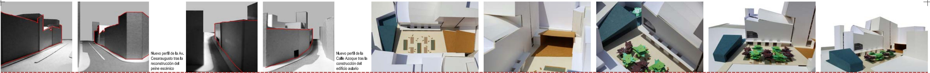
Nuevo perfil de la Av. Cesaraugusto tras la reconstrucción del peine escénico