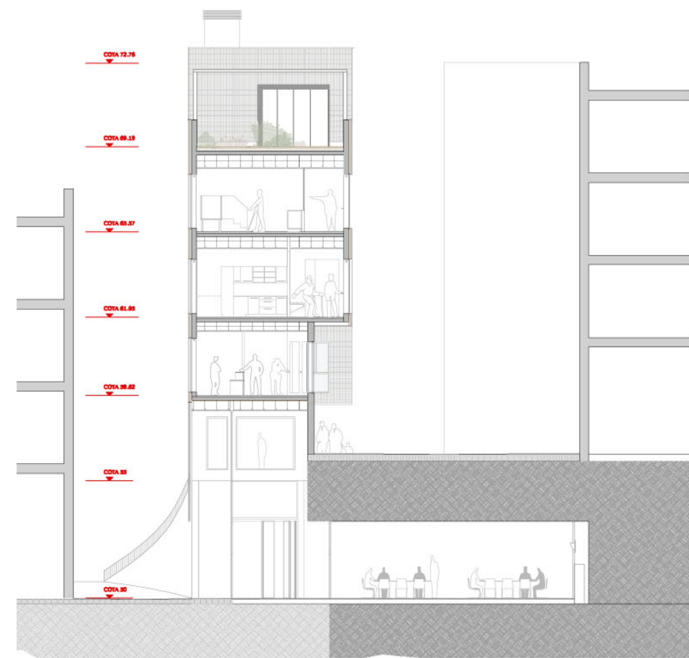
SECCIÓ TRANSVERSAL 2 e 1/100