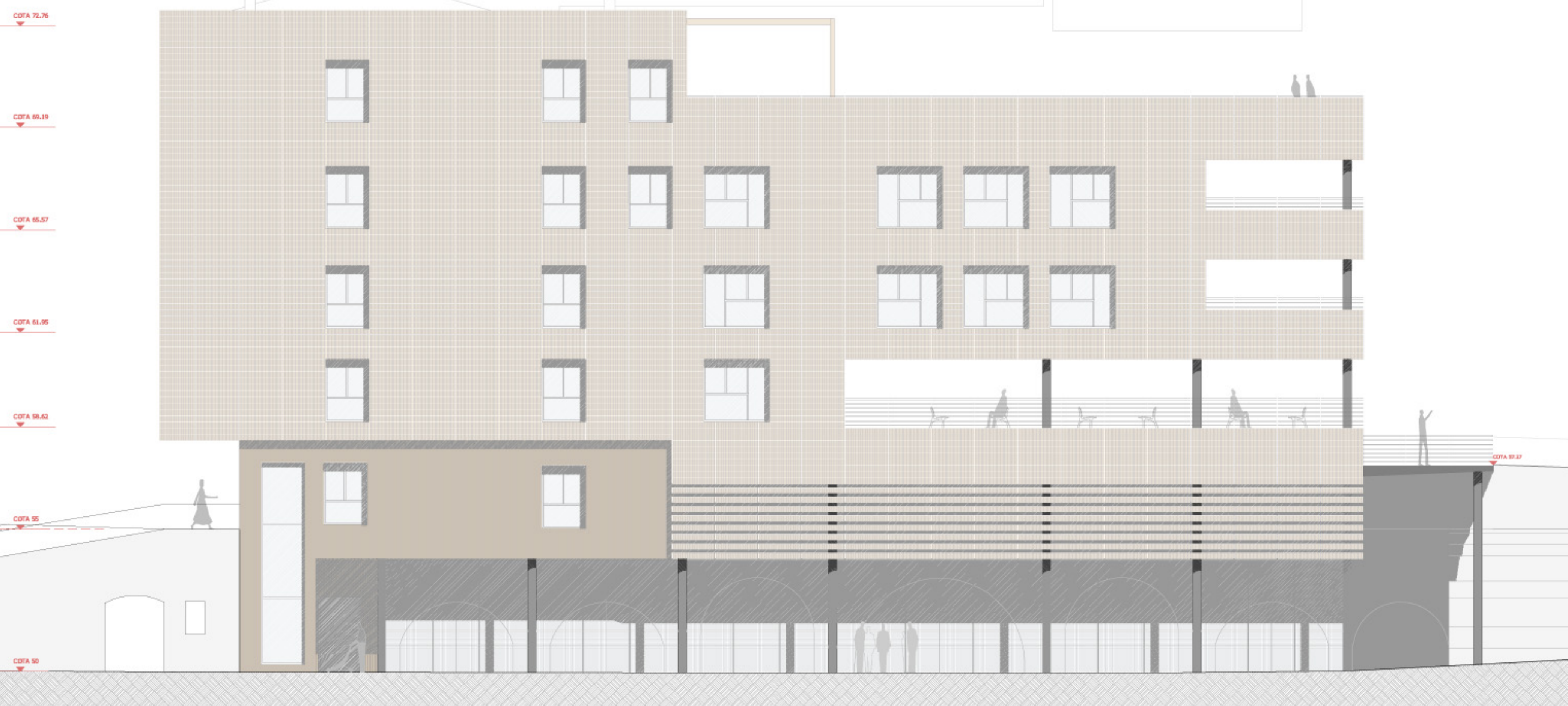
ALÇAT 1 e 1/100