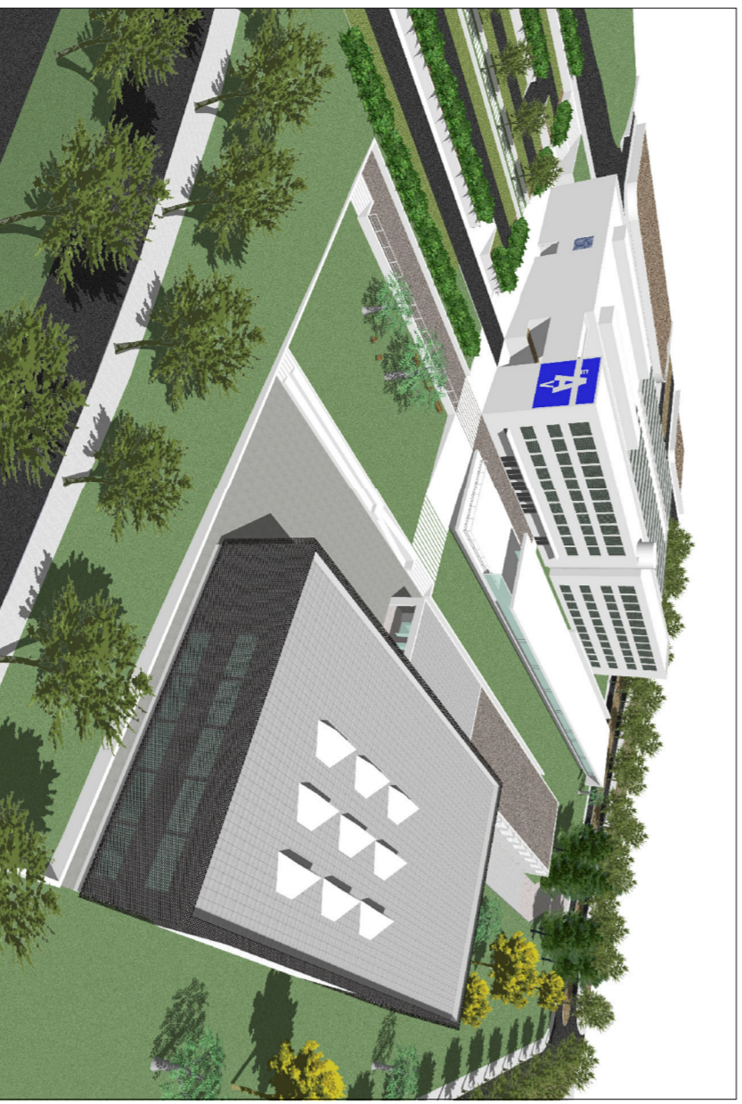
VISTA DEL CONJUNT