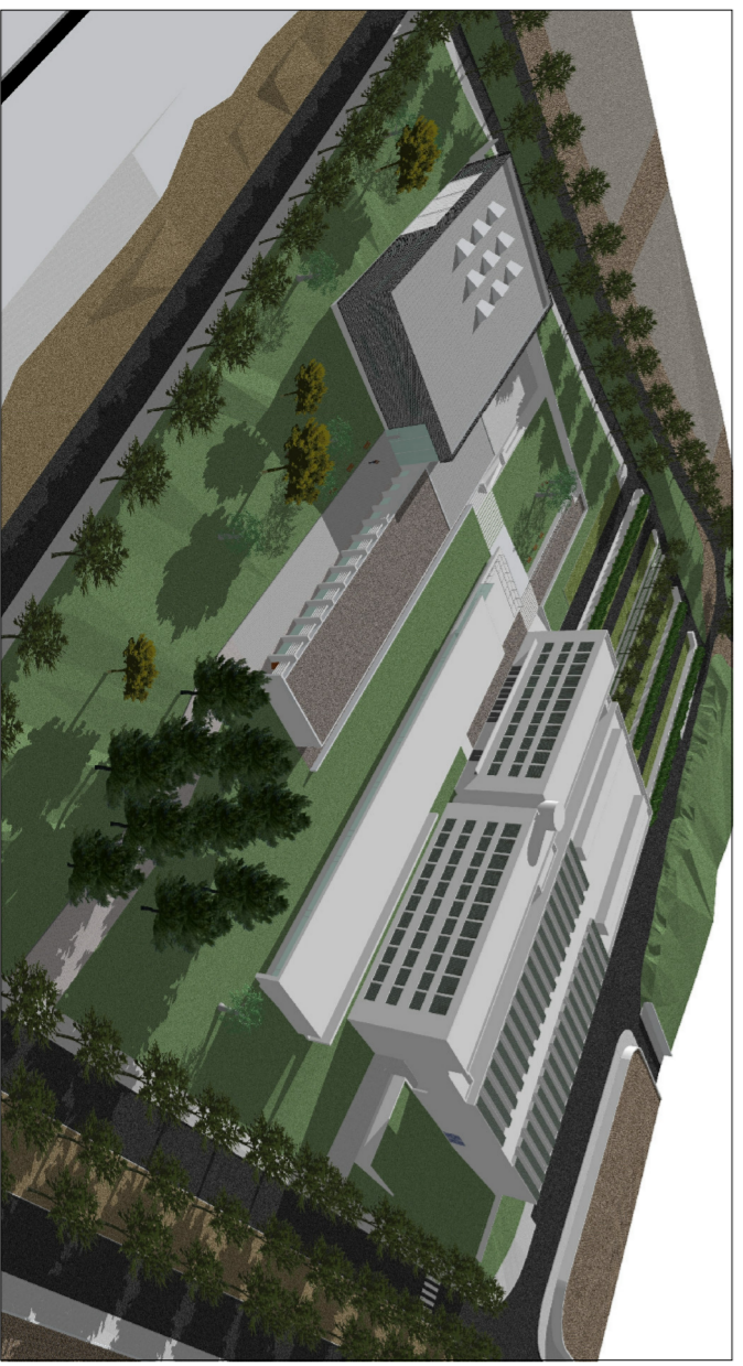
VISTA DEL CONJUNT