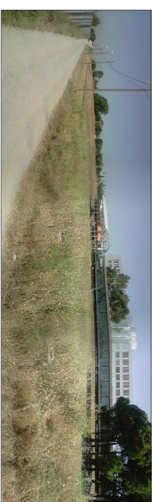
EMPLAÇAMENT DEL PROJECTE