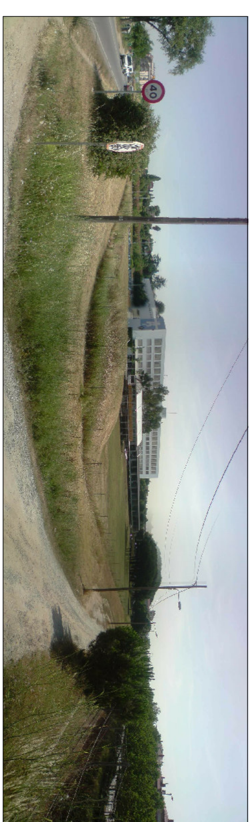
EMPLAÇAMENT DEL PROJECTE