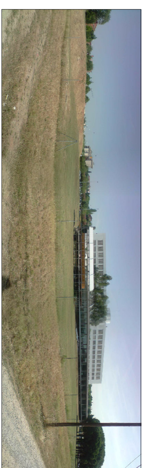
EMPLAÇAMENT DEL PROJECTE