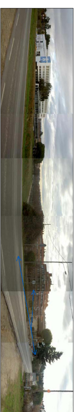
SUD: AVINGUDA DEL FERROCARRIL