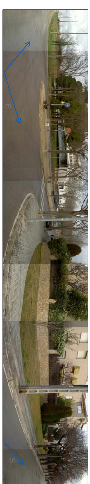
SUD: AVINGUDA DEL FERROCARRIL

EL SOLAR A EDIFICAR, AMB UNA SUPERFÍCIE DE 4.116M 2 , ES TROBA SITUAT AL DAVANT DE L'ESCOLA D'ARQUITECTURA. LIMITA AL NORD AMB L'EDIFICI DE L'ESCOLA, EL CENTRE DE RECERCA I TRANSFERÈNCIA DE TECNOLOGIES (CRIT) I AMB L'ACTUAL APLAÇAMENT A LA BANDA. ESTÀ AMB EL CARRER PERE SERRA, AL SUD AMB L'AVINGUDA DEL CARRIL I LA LÍNIA DE FERROCARRILS DE LA GENERALITAT (BARCELONA-TERRASSA) I A L'EST AMB LA CARRERETA DE VALLDORERA.