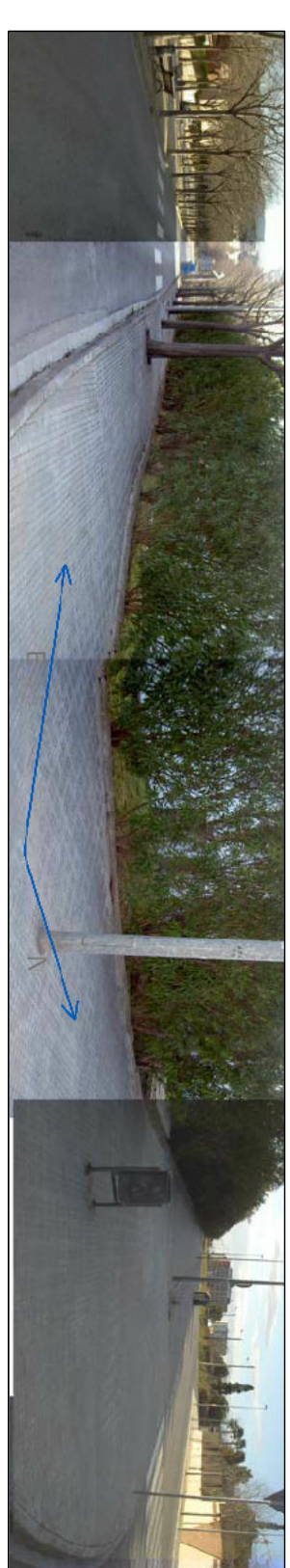
EST: CARRER PERE SERRA