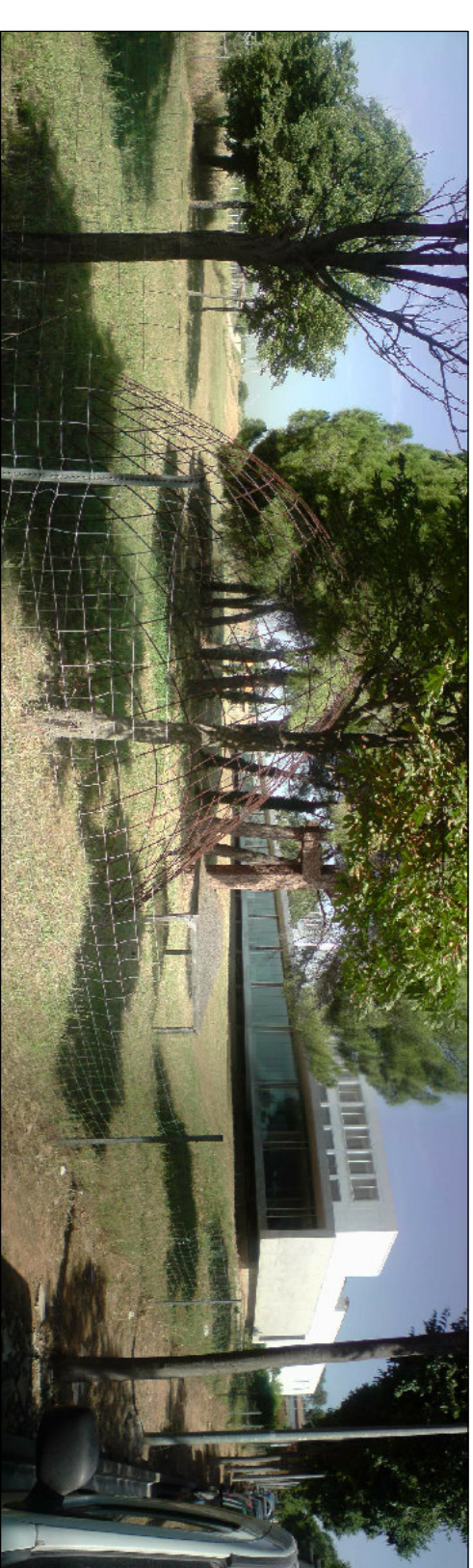
EMPLAÇAMENT DEL PROJECTE

L'EDIFICI DE L'ESCOLA D'ARQUITECTURA, AMB UNA SUPERFÍCIE DE 8.750M 2 , ESTÀ SITUAT EN UNA ZONA RESIDENCIAL DE SANT CUGAT, A UNS DEU MINUTS DE L'ESTADI DELS FERROCARRILS DE CATALUNYA. CADA COP MES I A UNA VELOCITAT MES ELEVADA, TÉ LA NECESSITAT D'ACTUALITZAR-SE PEL QUE FA A INFRAESTRUCTURES I A LA INCORPORACIÓ DE LES NOVES TENDÈNCIES. AMB ELS NOUS SISTEMES D'ARRENYATGE ES FA NECESSARI CANVIAR EL CONCEPTE DE BIBLIOTECA TRADICIONAL, I CREAR ESPAIS ADAPTABLES ALS CANVIS.