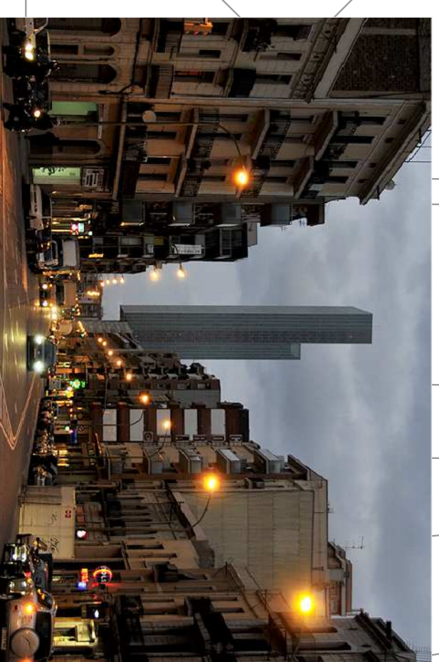
Carrer de Pere IV