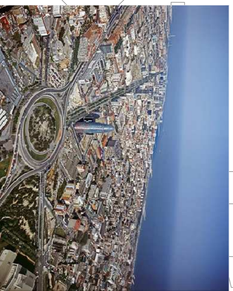
vista general del districte Z20

Des del 2000, ja s'hi han instal·lat més de 1.440 noves empreses que han generat més de 42.000 nous llocs de treball.