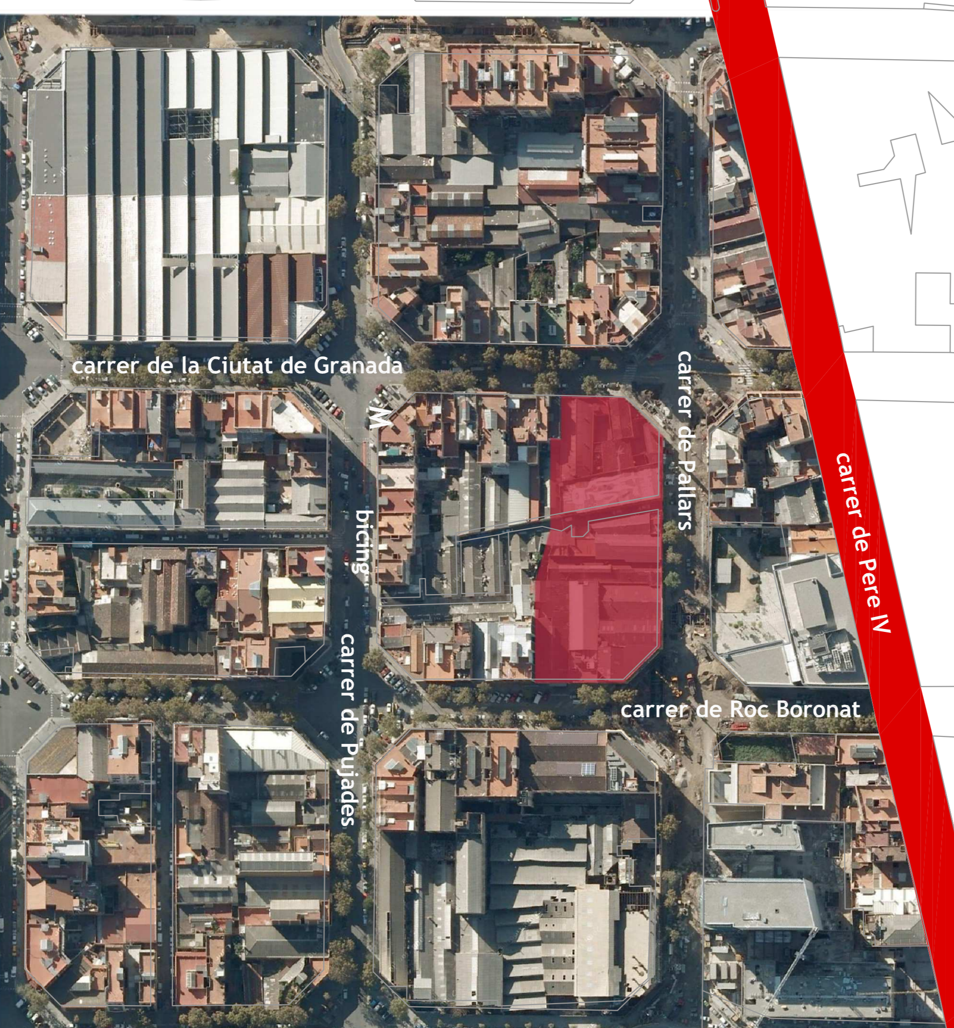
Carrer de Pere IV