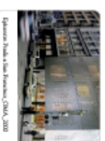
Esplanada Pública e Sala de Reuniões, CMAA, 2009