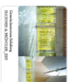
Comunicação e Sala de Reuniões, CMAA, 2009