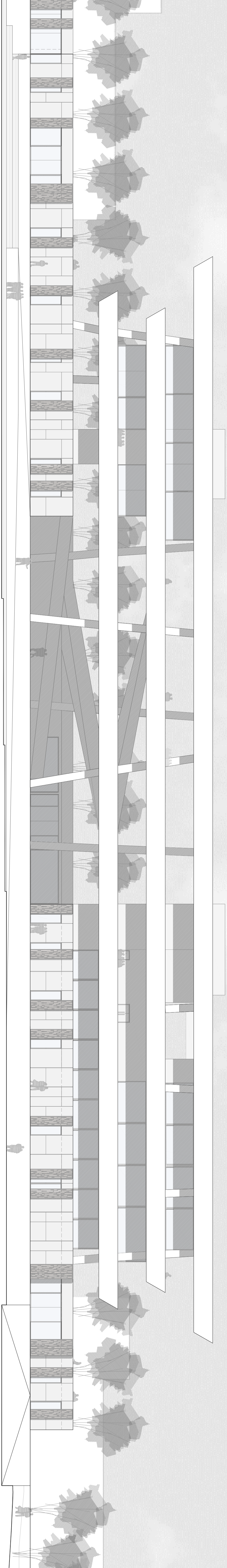
Alçat des de la presa, esc. 1/200