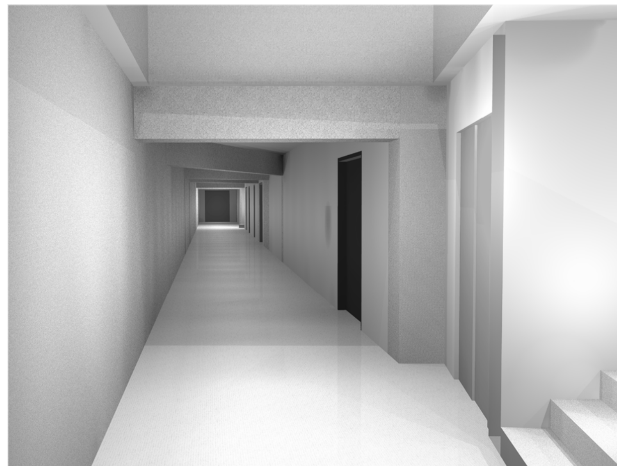
VISTA INTERIOR 3