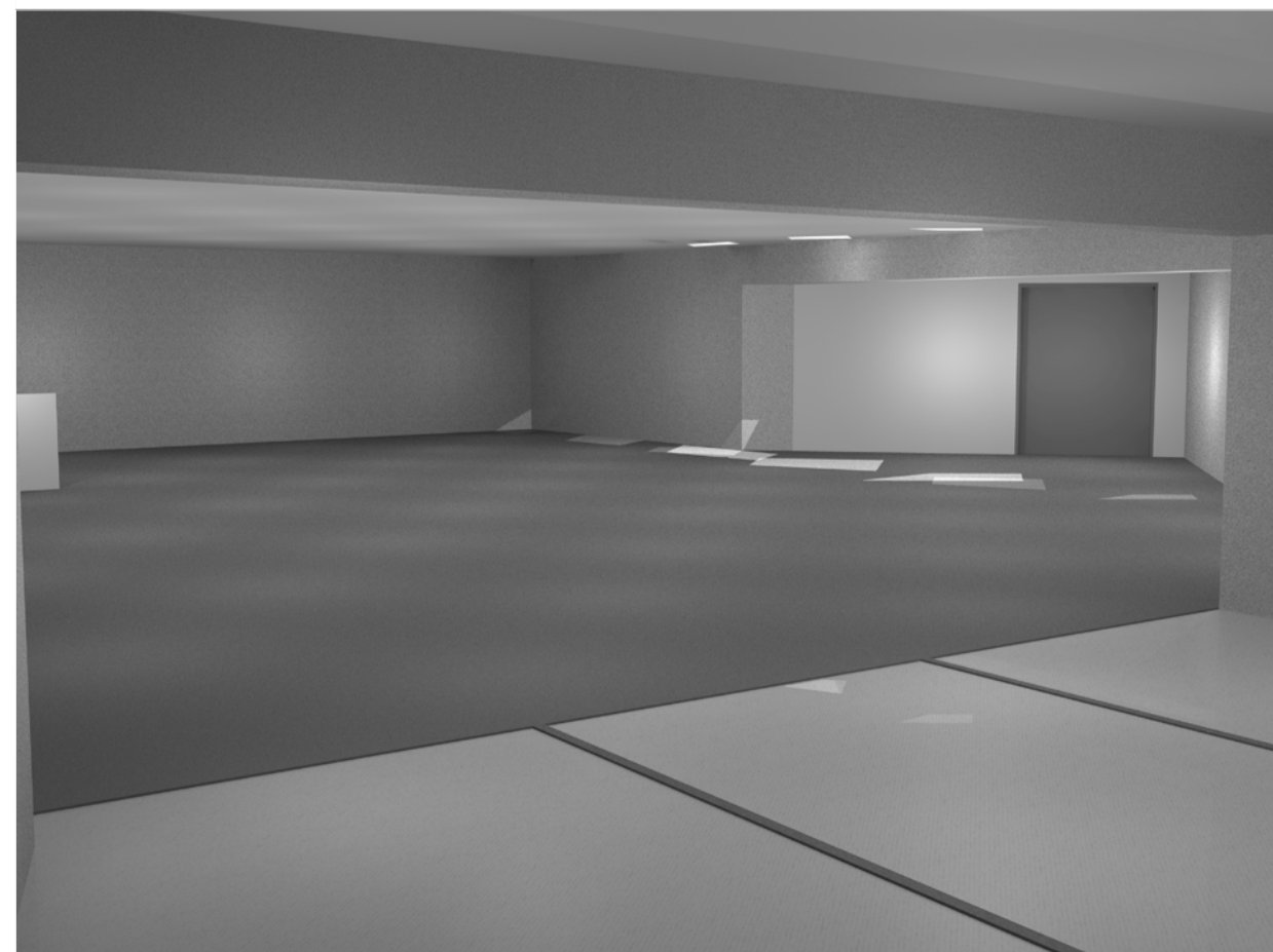
VISTA INTERIOR 1

01 Aposament cotxes funerària. 02 Sala bombes PCI. 03 Dipòsit aigua PCI. 04 Sala elèctrica. 05 Despats metge. 06 Arxiu mèdic. 07 Sala taralopràxia. 08 Vestidor metge masculí. 09 Vestidor metge femení. 10 Magatzem taules. 11 Magatzem eines i material.