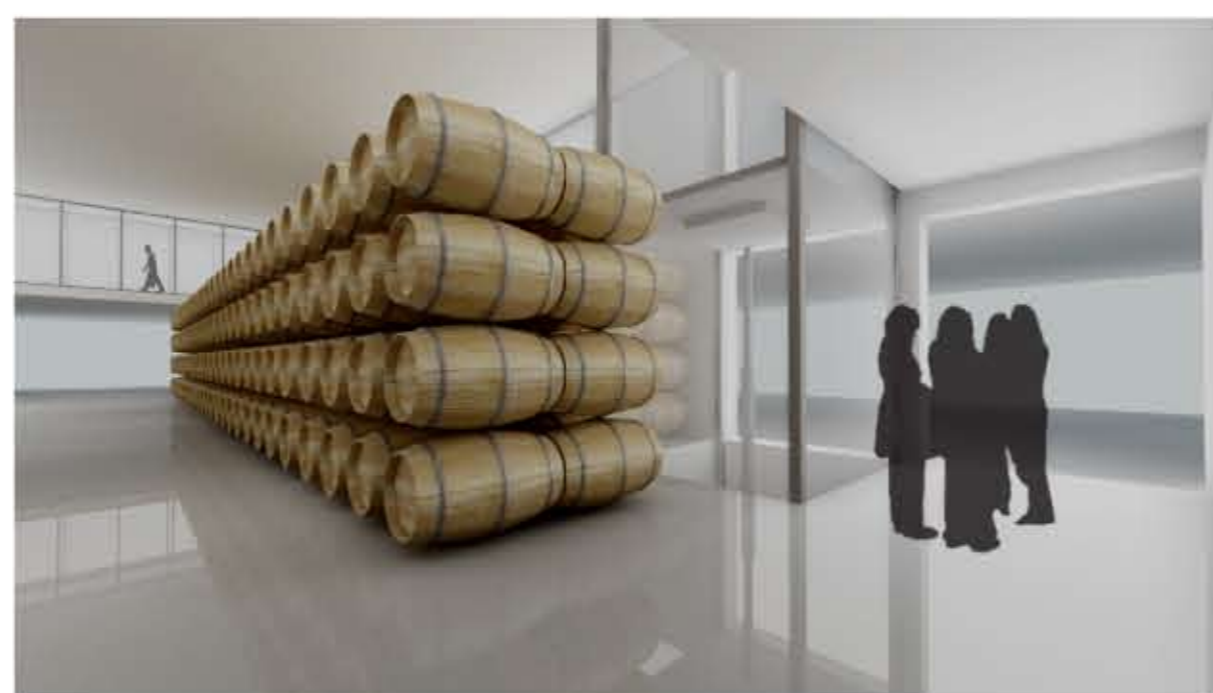
MOSCA, escala 1/1.000