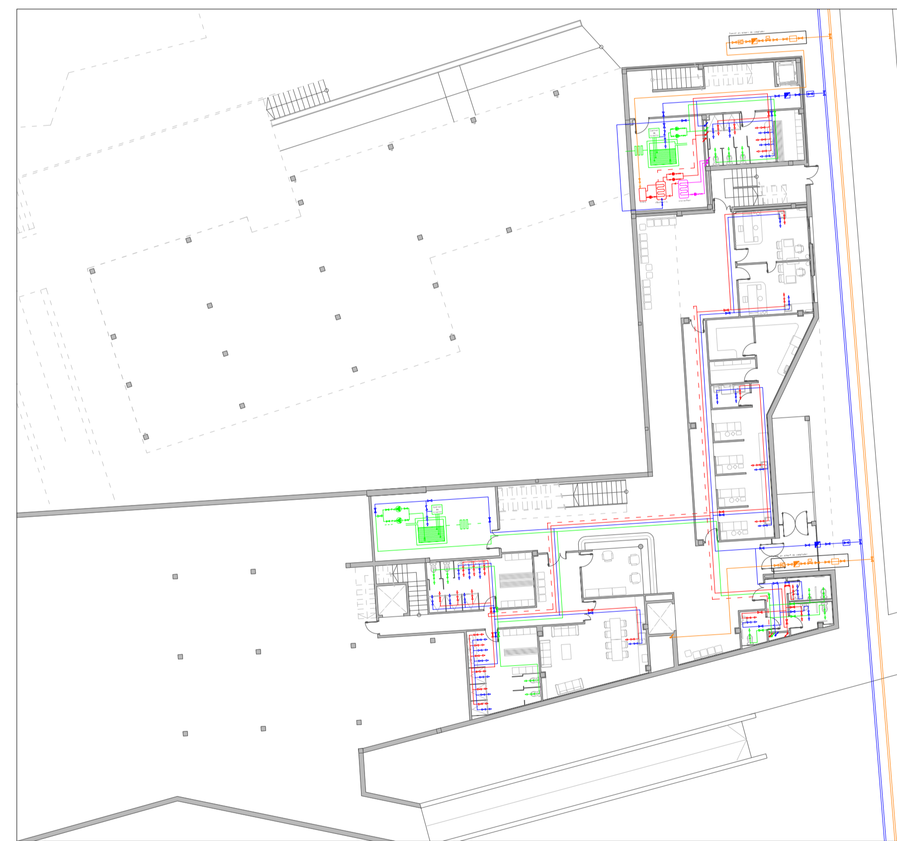
PLANTA SOTERRANI - ESCALA 1/250