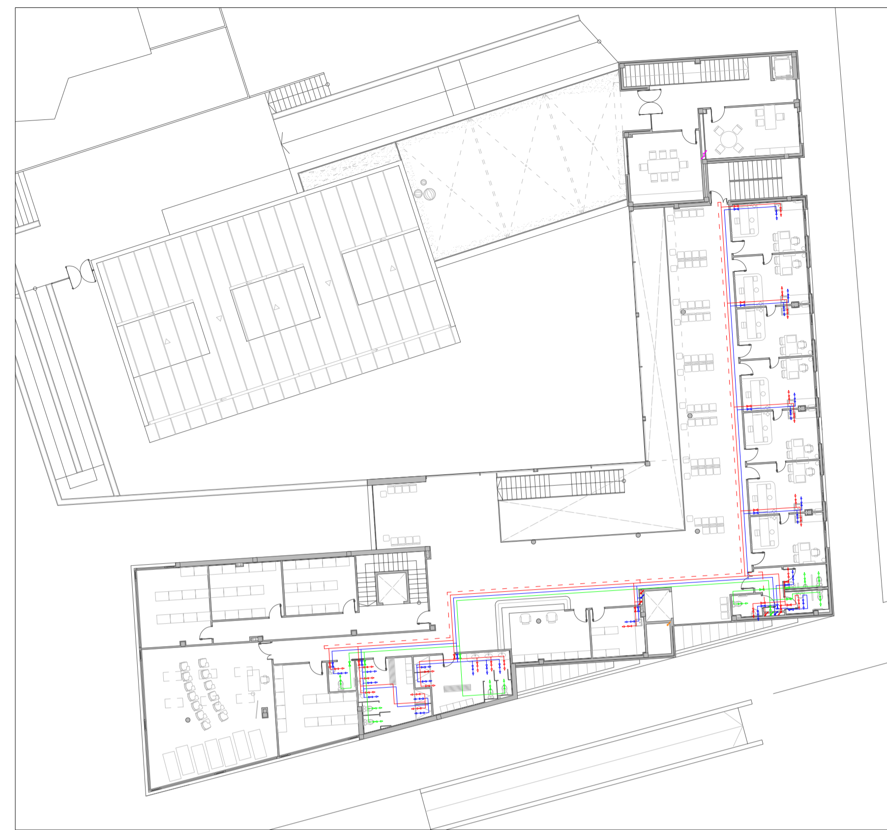
PLANTA PRIMERA - ESCALA 1/250