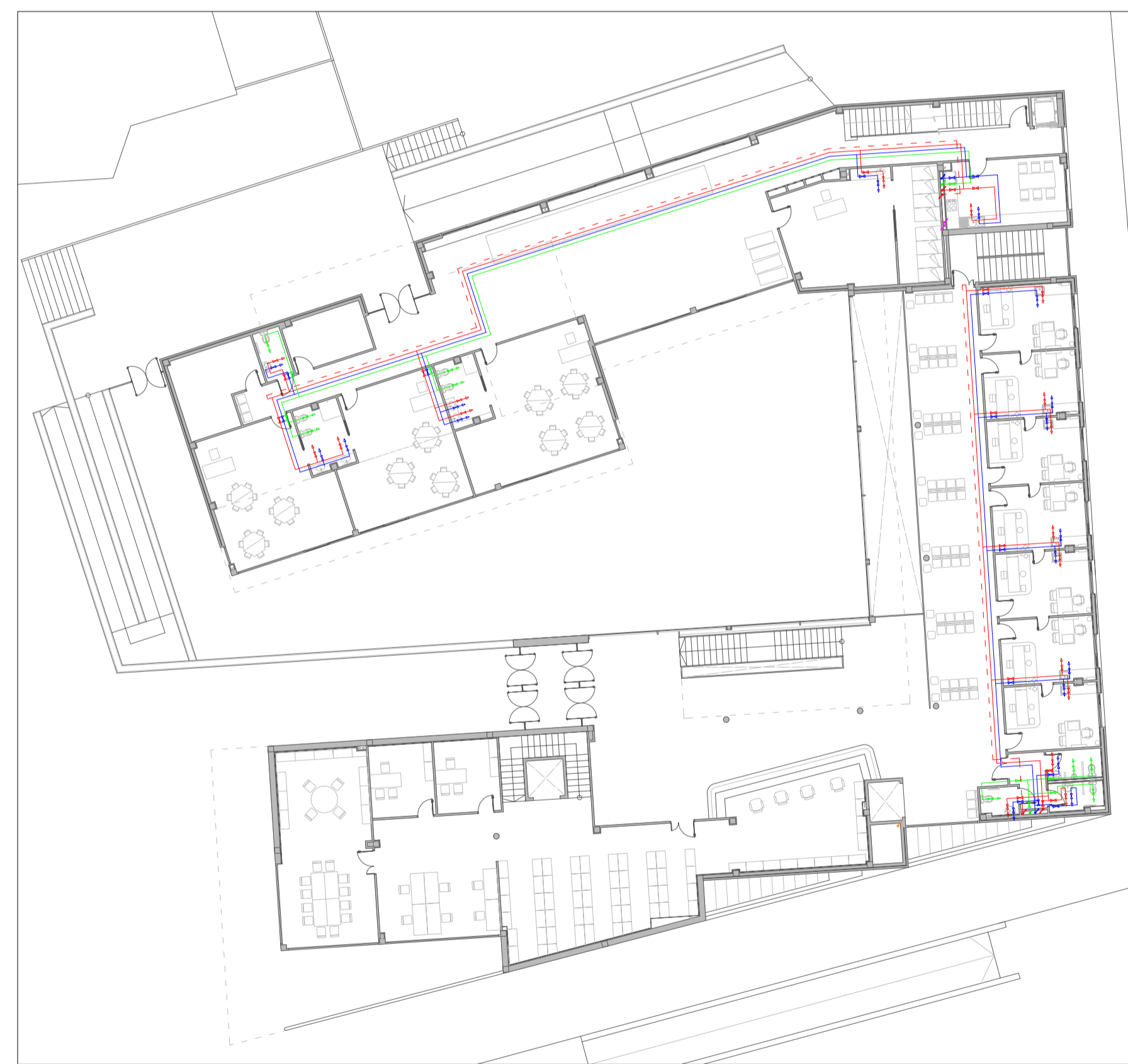
PLANTA BAIXA - ESCALA 1/250