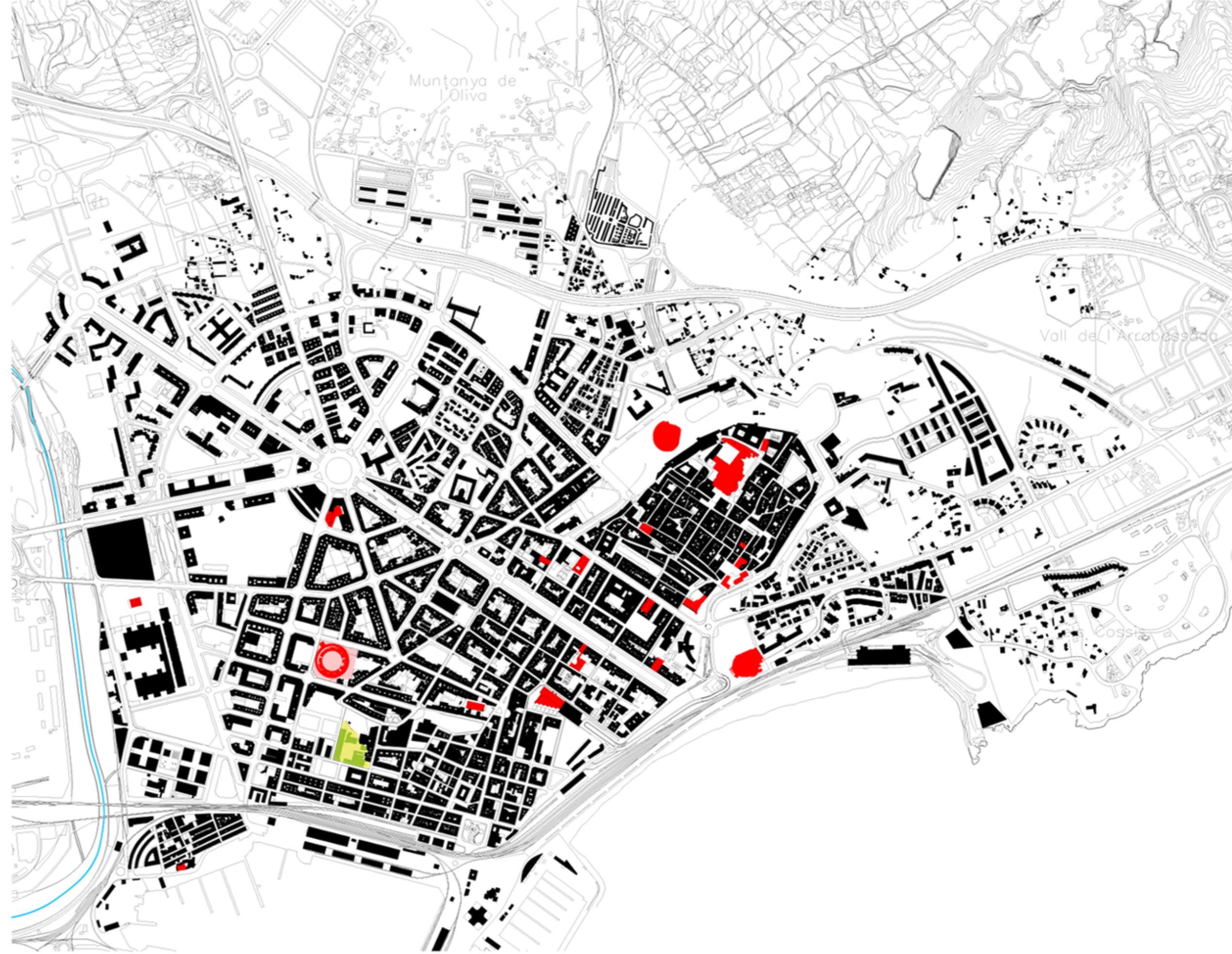
Equipaments lúdics i religiosos.