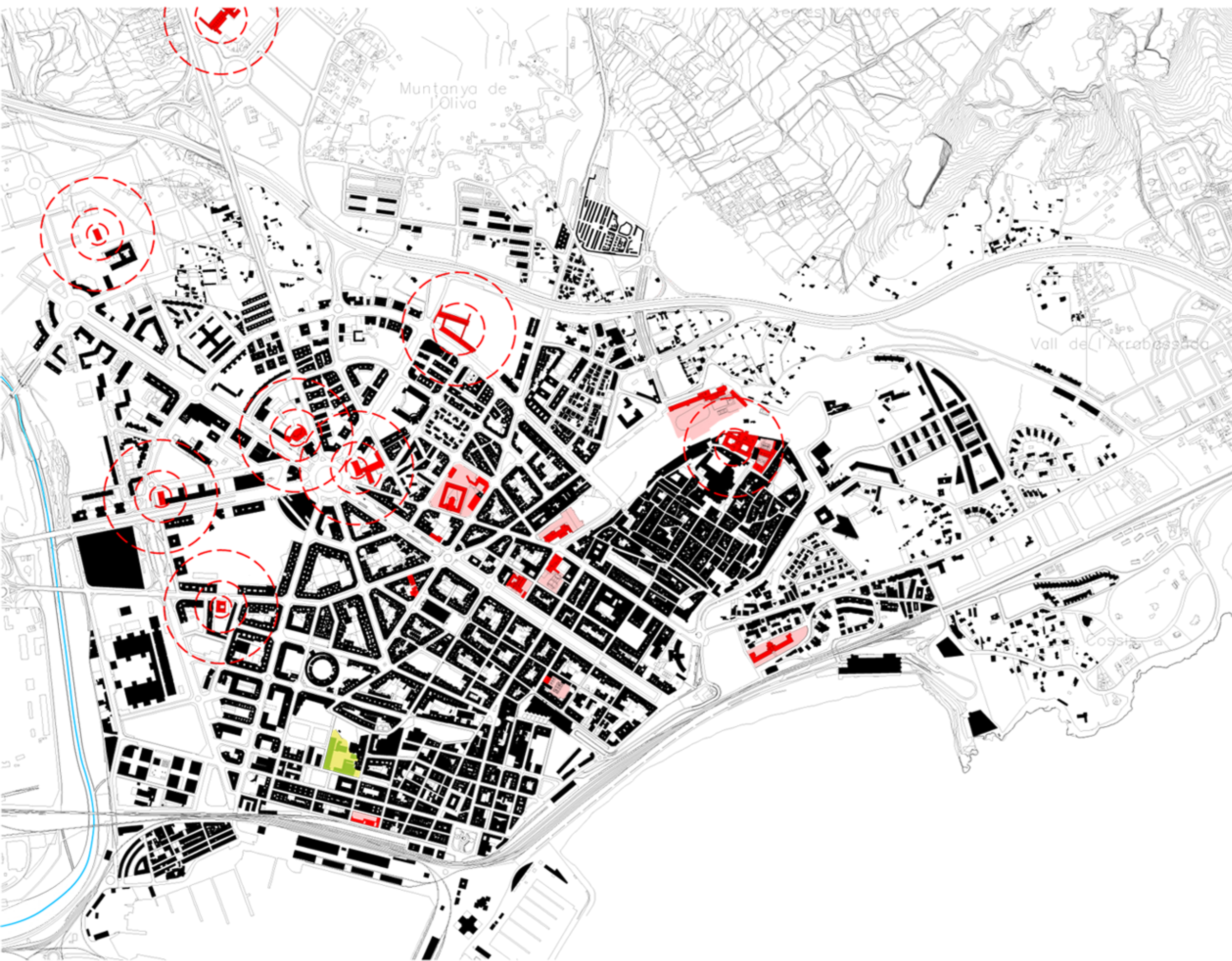
Escoles i Centres Educacionals d'àmbit supramunicipal.