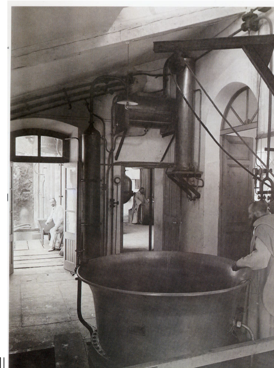
Pares cartoixans durant Pelaboració del licor a l'edifici del sucre.