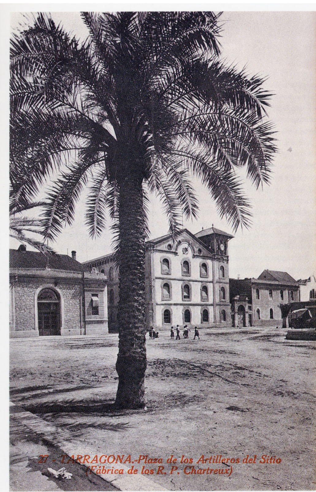
Postal de principis del segle XX de la Chartreuse.

(Olivé Serret, Enric. "La Chartreuse de Tarragona. De la fàbrica al convent")