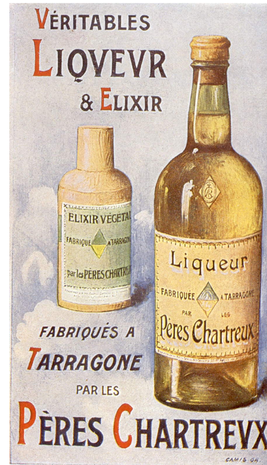
Anunci de l'Elixir i del Chartreuse cap al 1905.