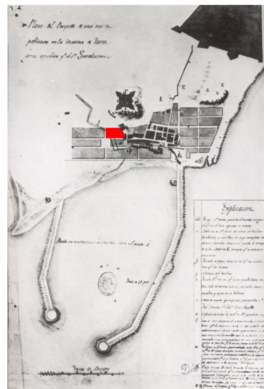
"Proyecto de la Nueva Población de la Marina". 1802.