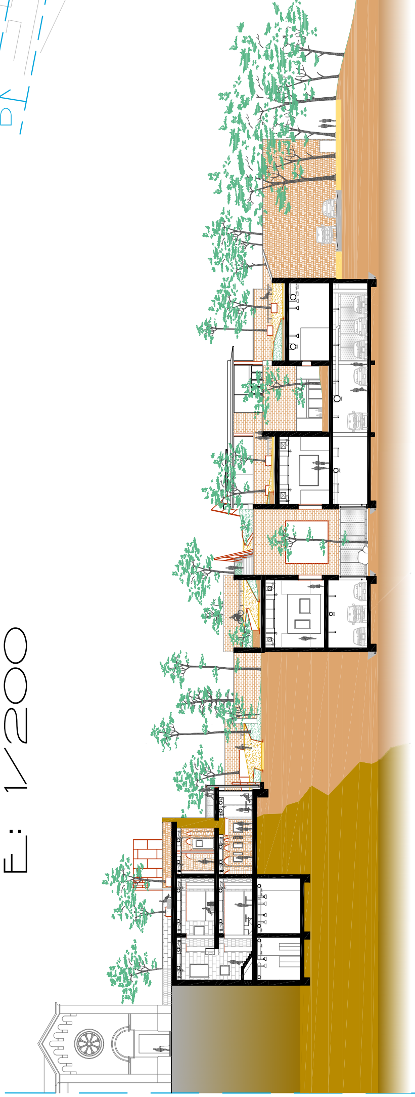
SECCIÓ A: E: 1/200