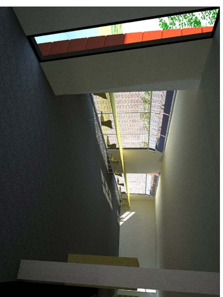
IMATGE DE TREBALL INDIVIDUAL