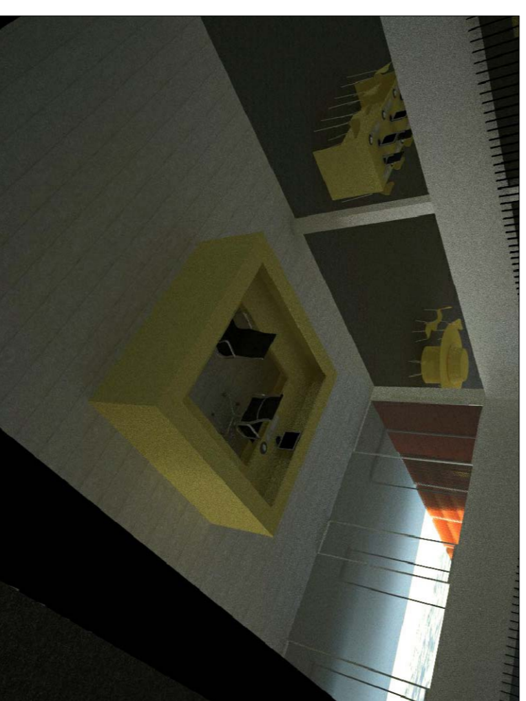
VISTA SUPERIOR DE L'ACCÉS