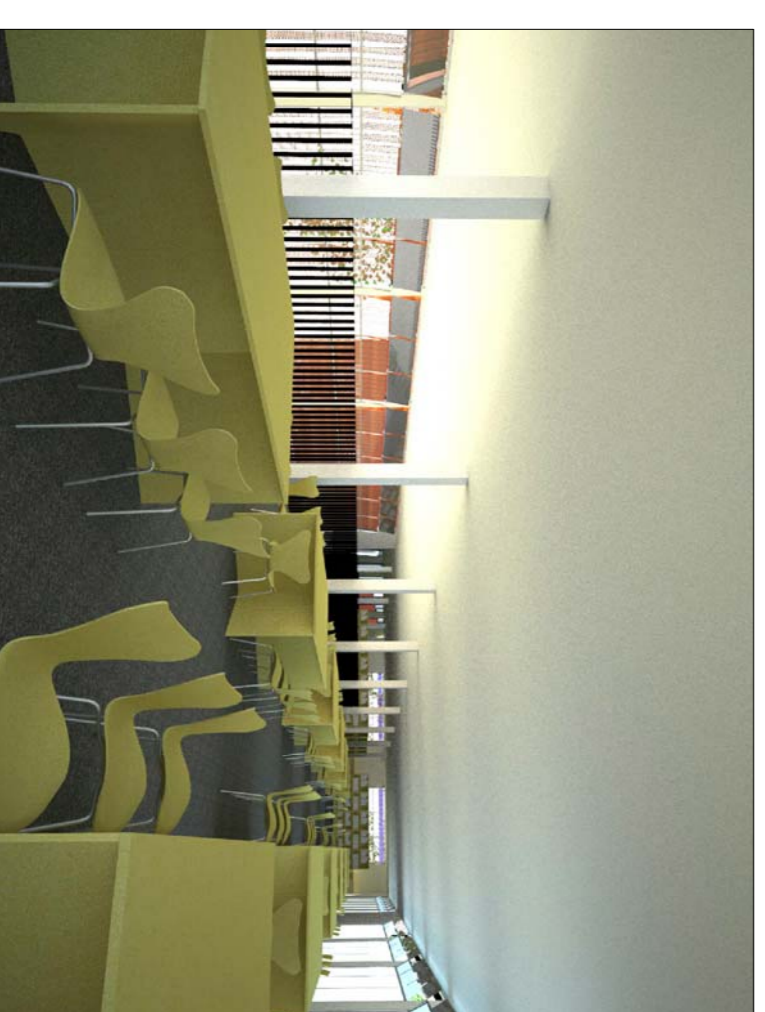
IMATGE DE L'ESPAI DE TREBALL EN GRUP