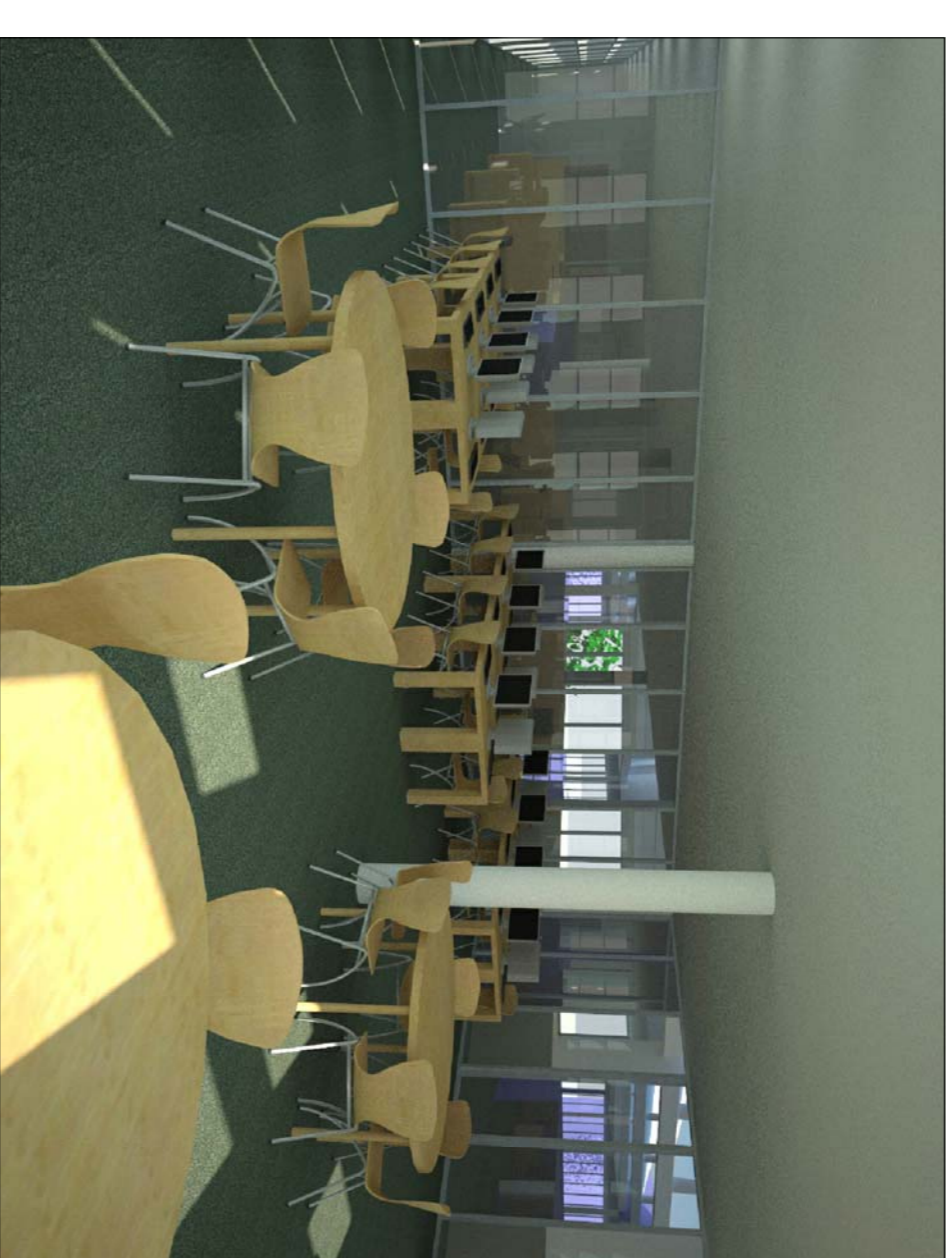
Zona de descans i Seminaris