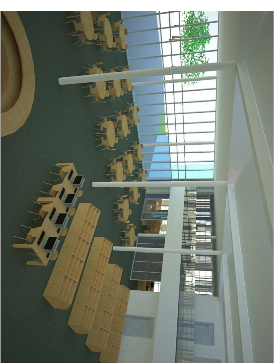
Treball en grup