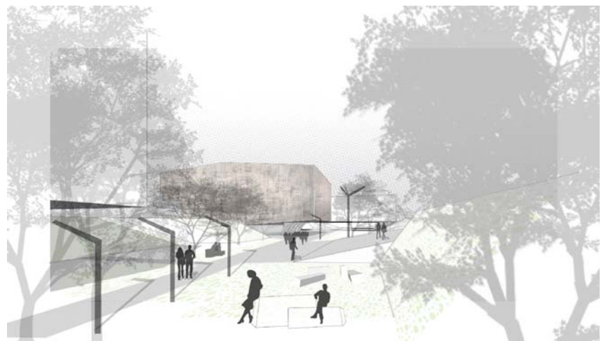
VISTA DES DE EL PARQUE