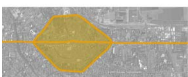
S. XV CITADELLA