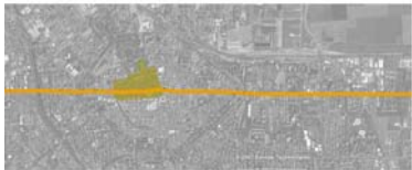
REGGIO EMILIA 190 A.C.