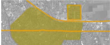
1904_FUNDACIÓN DE LA REGGIANE