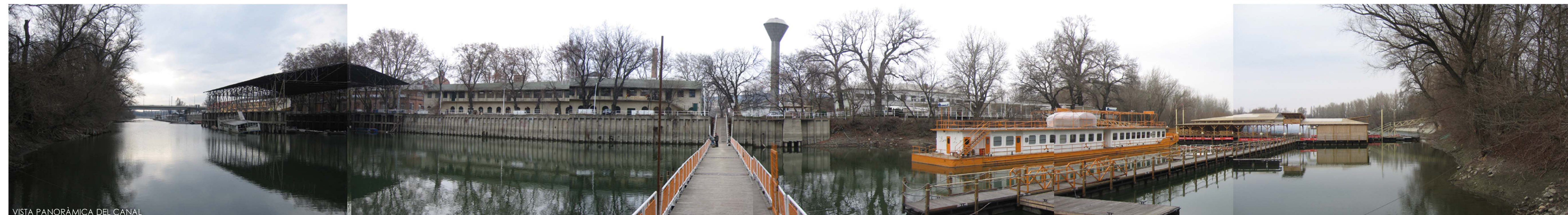
VISTA PANORÀMICA DEL CANAL