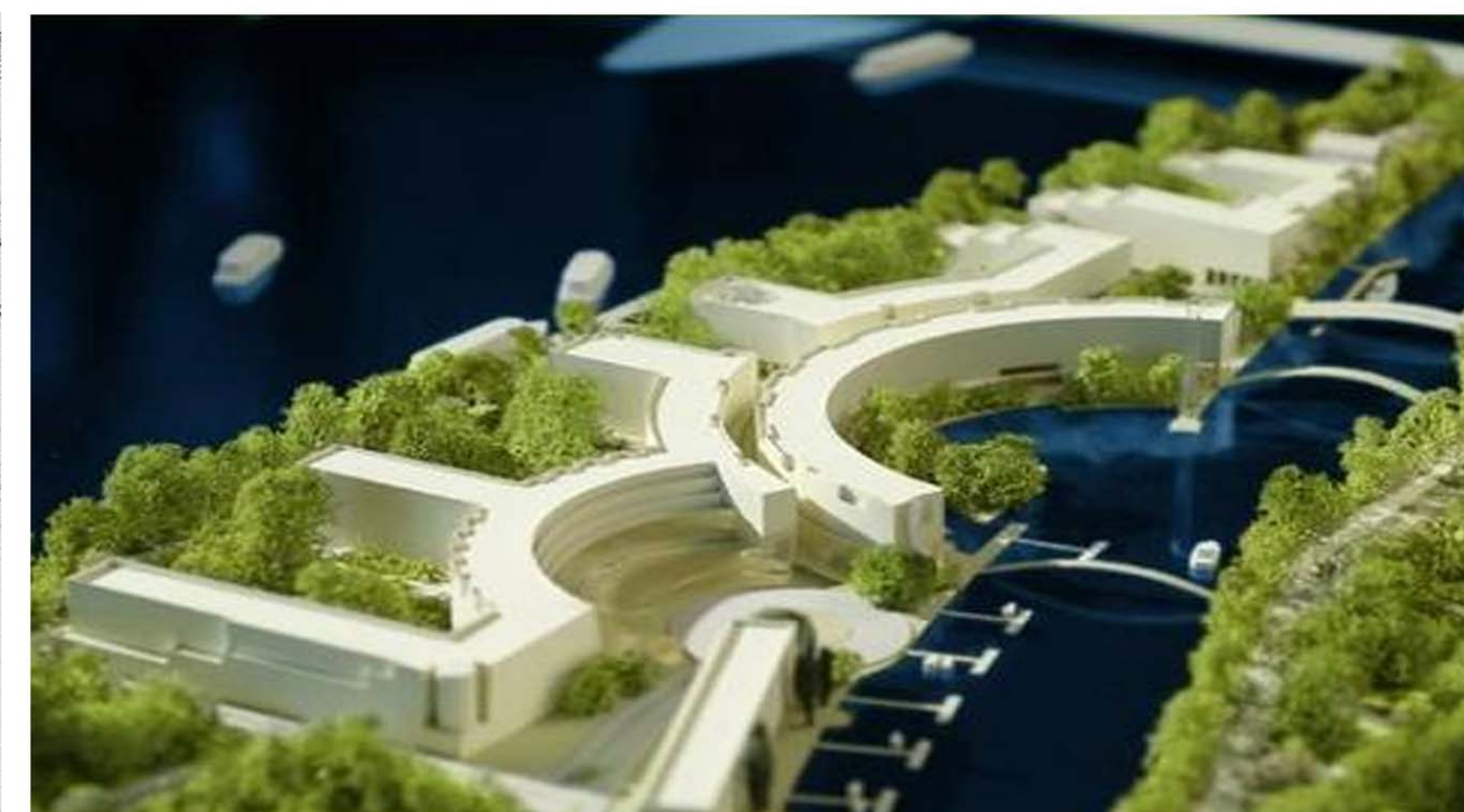
PROJECTE DREAM ISLAND 2010