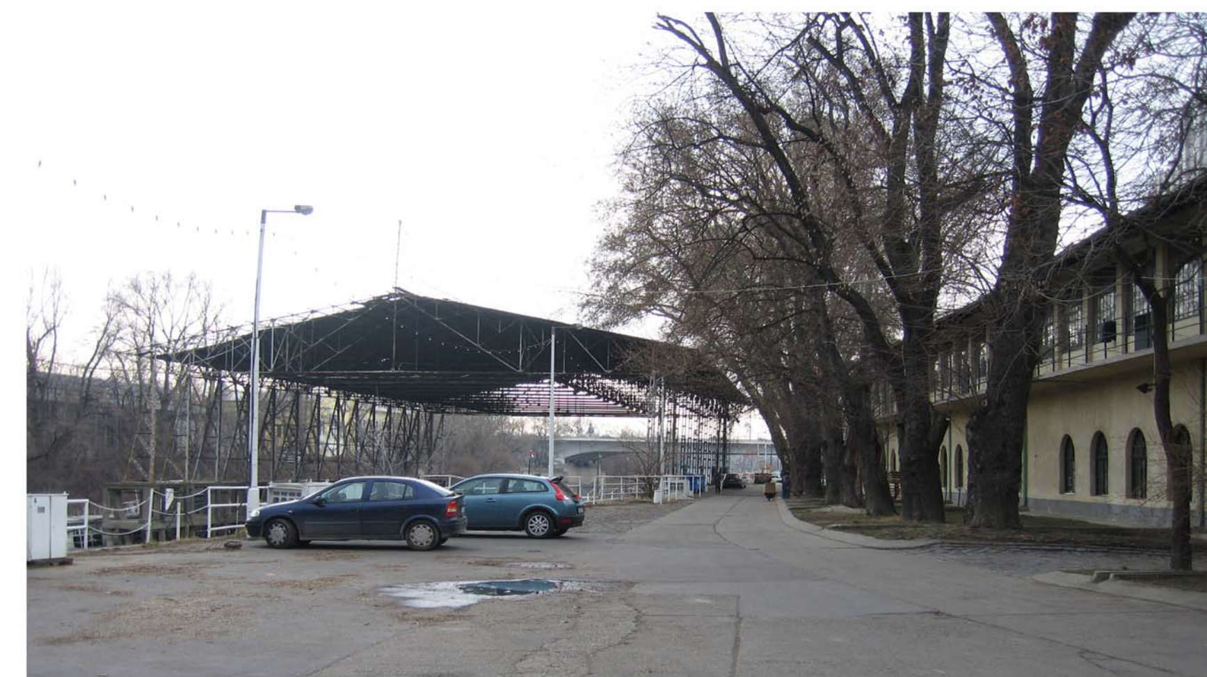
ACTUAL PASSEIG FLUVIAL