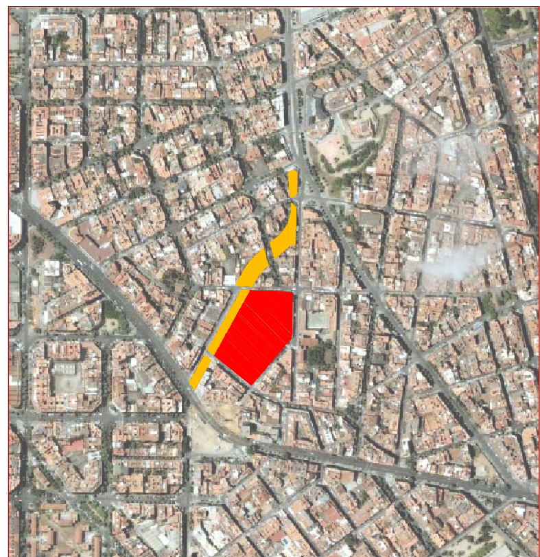
entorn de l'emplaçament

Un projecte urbanístic de l'ajuntament preveu la obertura d'un viad de connexió entre el passeig Viragalli i la ronda del Mig elixamplant i allargant el carrer Tenedor. L'objectiu és convertir en un ample viad de doble sentit permetent així peatonalitzar bona part dels carrers del barri. Això provoca noves creacions o molts edificis de l'entorn. L'ambé del solar que ha de cedir part del terreny per engrandir el carrer i les voreres.