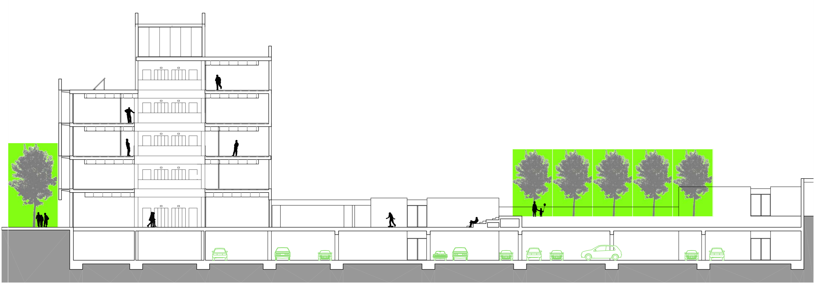
SECCION LONGITUDINAL APARCAMIENTO