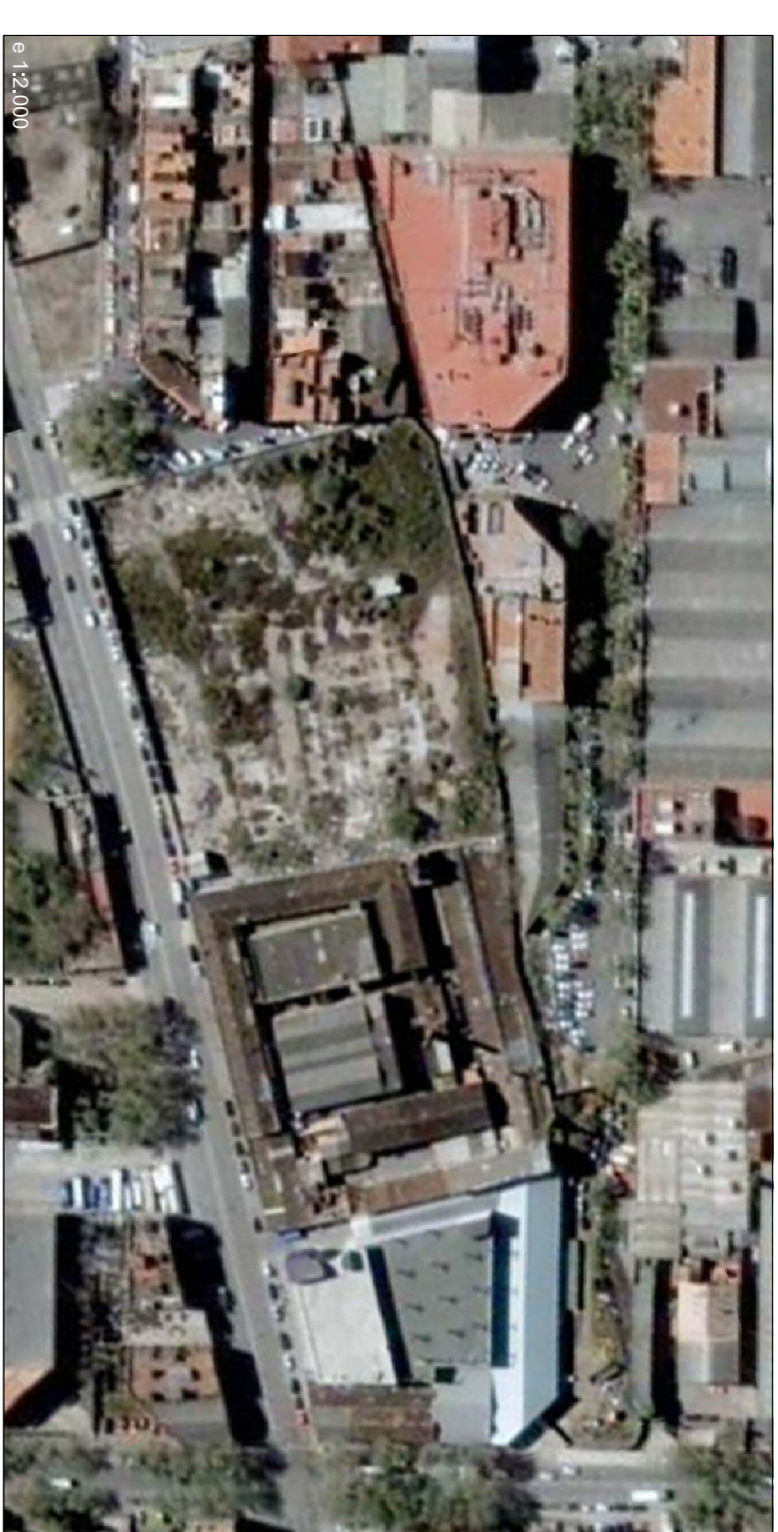
L'edifici de l'exvenderi és l'antiga fàbrica tèxtil de La Escocesa i un solar buit adjacent, situats entre els carrers Pere IV, Bòlvila, Fluvial i Selva de Mar del Poblenou.