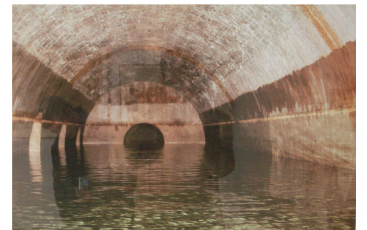
Vista dels dipòsits navegables del castell de Sant Ferran

L'abstracció de les traces de la roca del Cap de Creus es converteixen en traces de llum sobre les parets del soterrani.