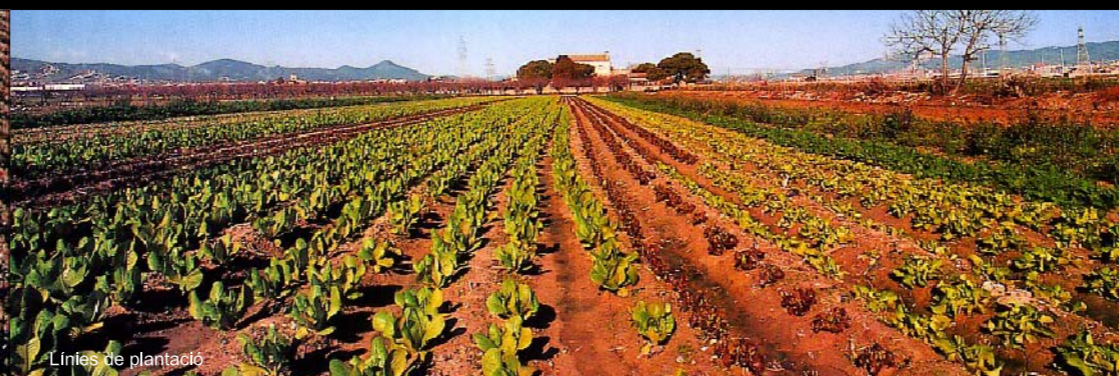
Línies de plantació