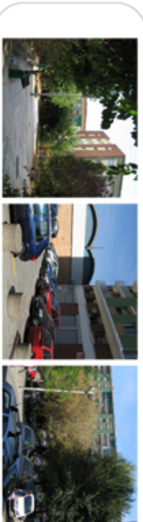
ESP AIS ENTRE BLOCS