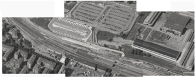
Espai de La Reggiane a rehabilitar i reconvertir, amb l'estació actual, l'aparcament i l'estació d'autobusos a l'aire lliure.