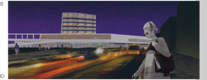
VISIO NOCTURNA DE L'EDIFICI