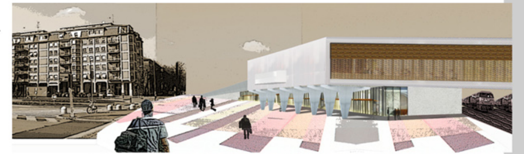
VISTA DE L'ACCÉS A L'ESTACIÓ