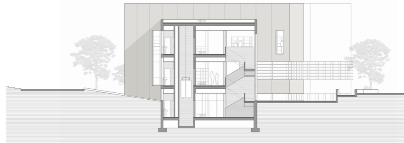
Secció transversal T1-T1'