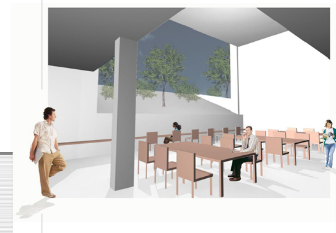
Sala de lectura