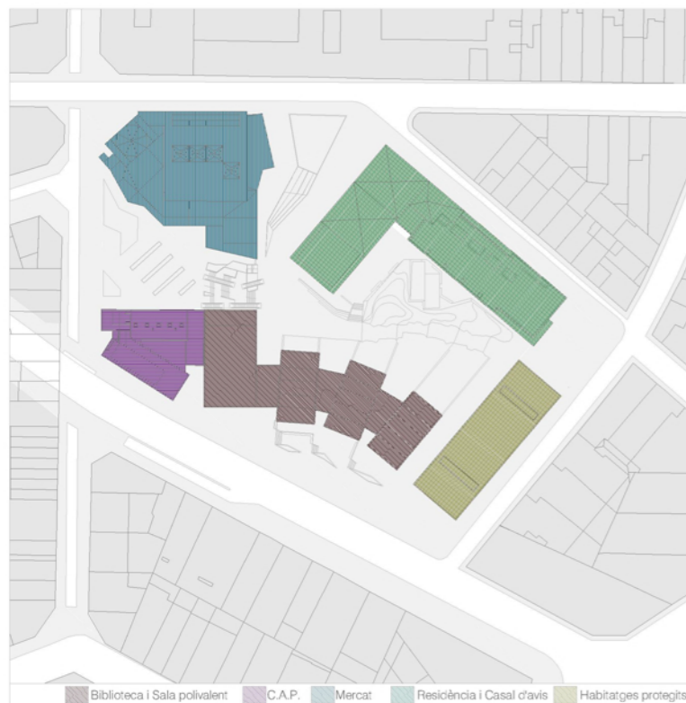
PROGRAMA DE LA ILLA D'EQUIPAMENTS E: 1/1000

Al límit oest del barri es situa un dels grans equipaments de la ciutat, que és l'Hospital de Sant Pau. Fora d'aquests les mancances d'equipaments del barri són evidents, en el centre només destaca factualment el mercat municipal, i la resta d'equipaments es reparteixen als límits del districte. En quant a l'espai públic, com s'ha esmentat anteriorment, el barri compta amb el parc del Guinardó a l'extrem nord, els jardins de Frederica Montseny tocant la Ronda, i la Plaça Maragall a l'extrem sud. Hi ha places de tipologia més urbana com són el cas de la Plaça Catalana o Plaça Guinardó. L'emplaçament del projecte fa que aquest pugui constituir un nou punt de centralitat del barri, així com funcionar com a enllaç entre el parc i la Plaça del Guinardó, formant un autèntic eix cívic per al barri.