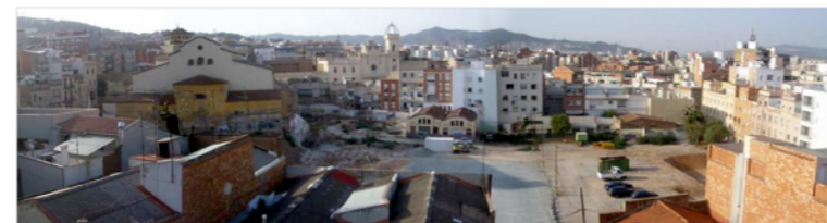
VISTA PANORÀMICA DE LA FUTURA ILLA D'EQUIPAMENTS AL BARRI DEL GUINARDÓ