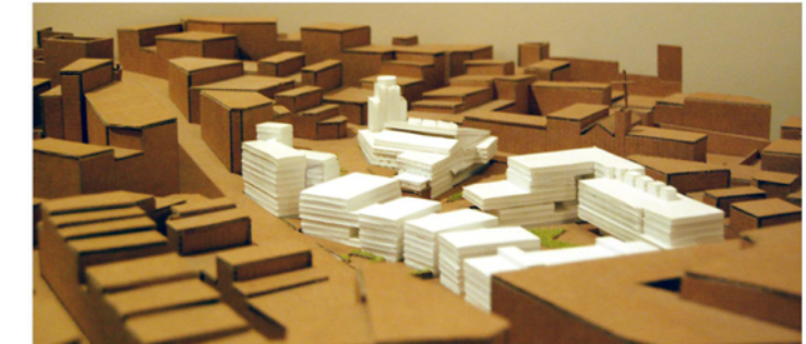
VISTES MAQUETA DE L'ENTORN DE LA ILLA D'EQUIPAMENTS