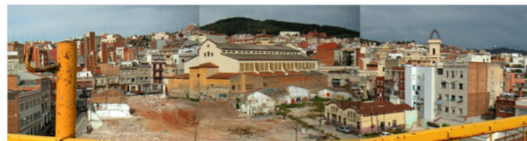
VISTA PANORÀMICA DE LA FUTURA ILLA D'EQUIPAMENTS AL BARRI DEL GUINARDÓ