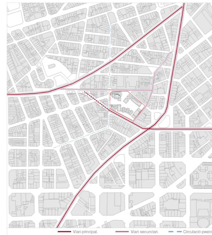
ESQUEMA CIRCULACIÓ VIÀRIA E: 1/5000 — Viari principal. — Viari secundari. — Circulació peatonal