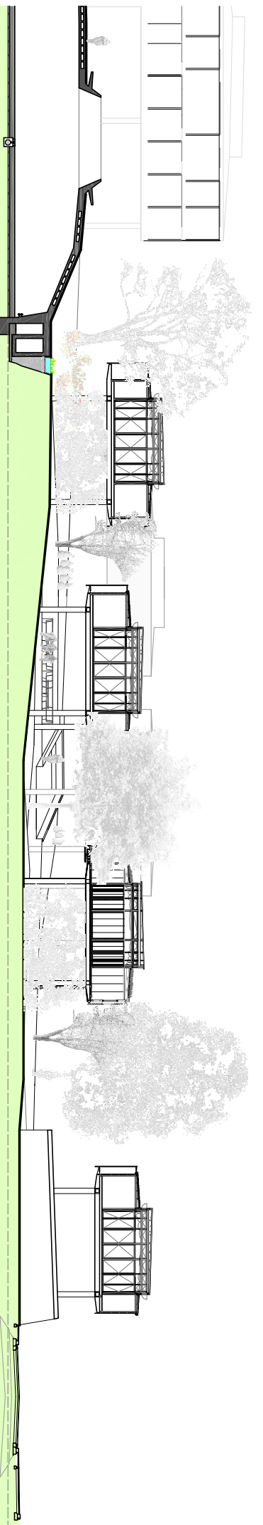
SECCIÓ DE LA MANSANA E: 1/200