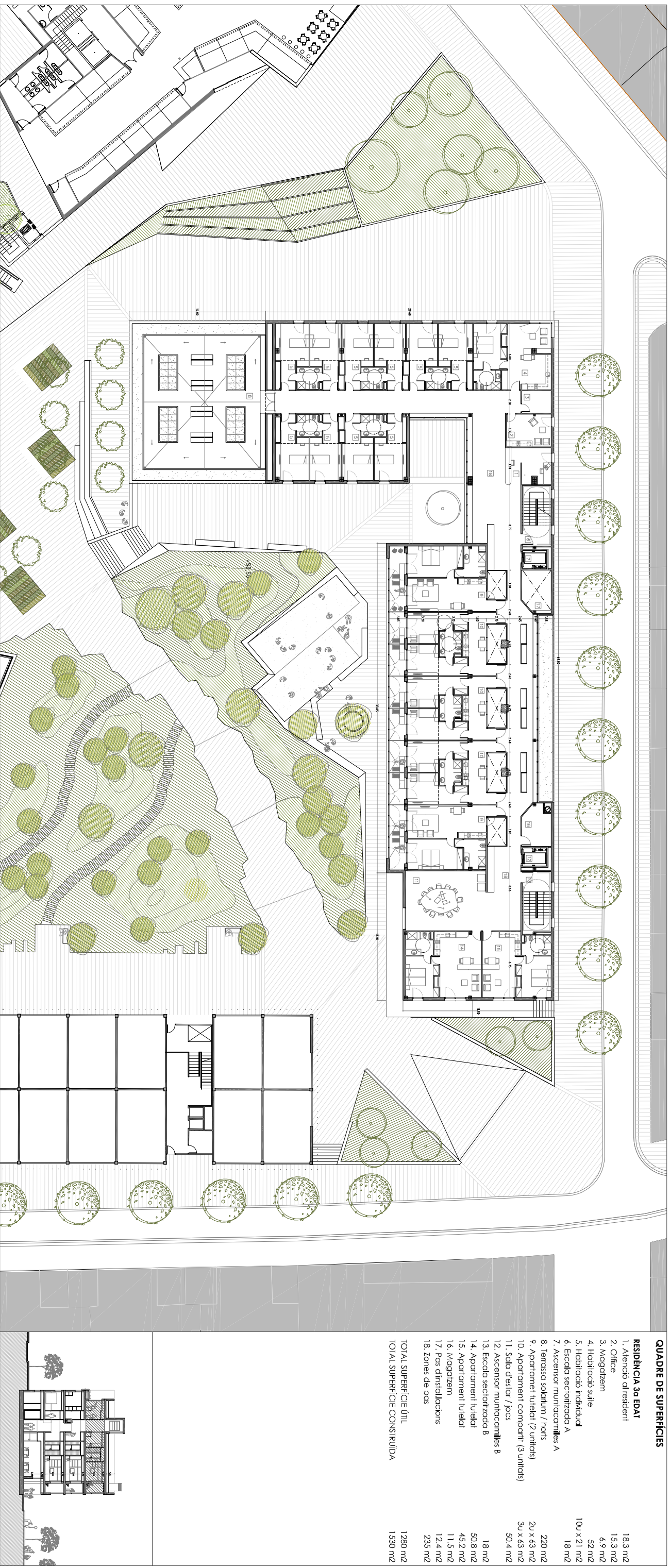
PLANTA SEGONA. cota +59,55