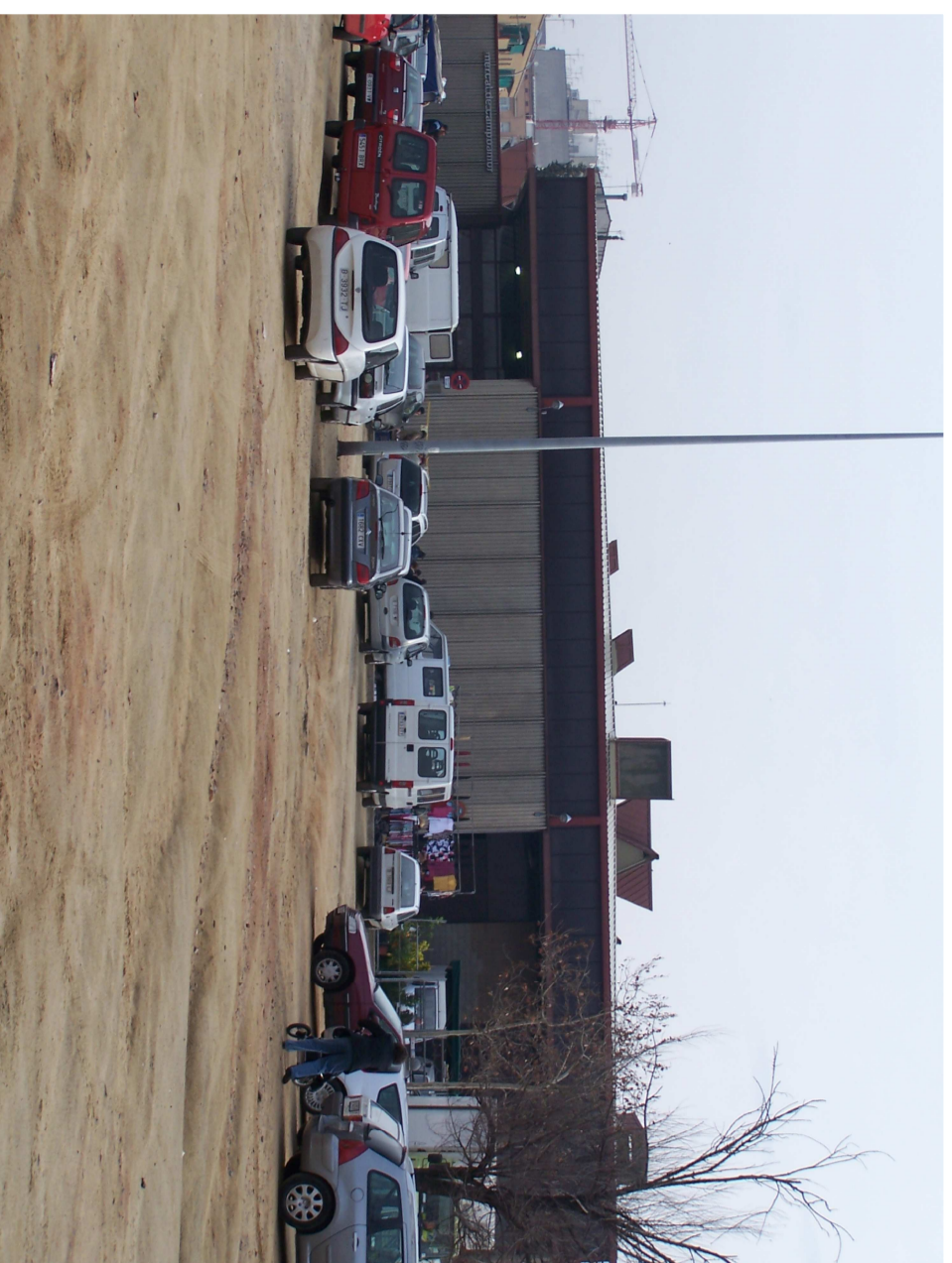
APARCAMENT DAVANT DEL MERCAT

L'actual mercat se situa en dins un conjunt d'equipaments on hi trobem la Plaça Picasso, un Centre Cívic, de nova construcció, l'Institut del barri i el camp de futbol. També hi ha una reserva d'espai a tocar del Centre Cívic, actualment utilitzat com a aparcament, on l'ajuntament té planejat construir-hi un C.A.P. El projecte de convertir el camp de futbol en un nou parc (hi ha un altre molt a prop millor equipat) junt amb les dues noves actuacions deixen clara la intenció de l'ajuntament de renovar aquest espai i crear un nou nucli de centralitat al barri en forma d'equipaments.