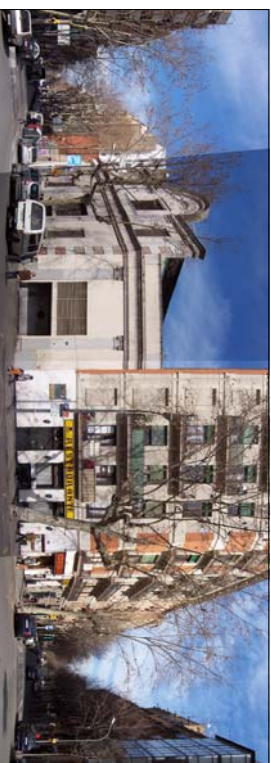
VISTA DEL XAFLA DE L'ILLA DESDE L'AV. PARAL·LEL