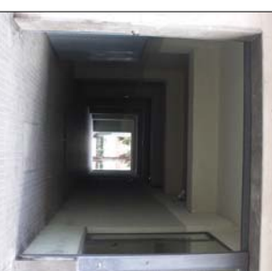
Passatge d'accés al pati interior d'illa pel Carrer Manso.