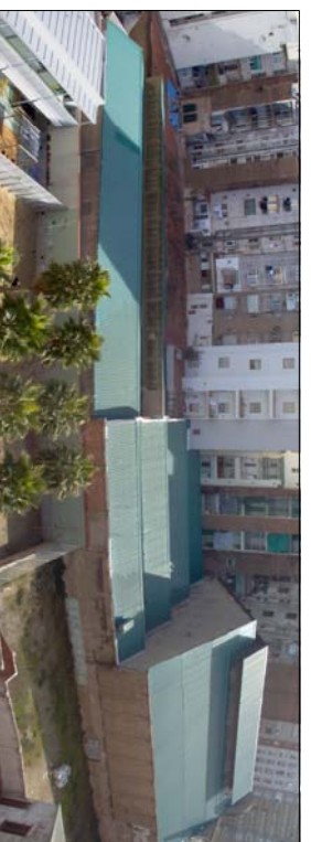
FAÇANA LONGITUDINAL INTERIOR