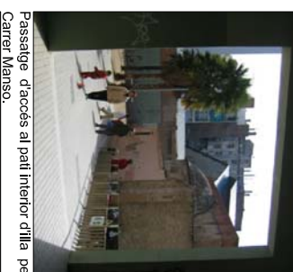
Passatge d'accés al pati interior d'illa pel Carrer Manso.