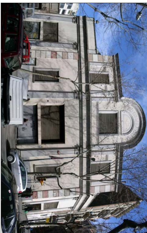
FAÇANA CARRER CALÀBRIA