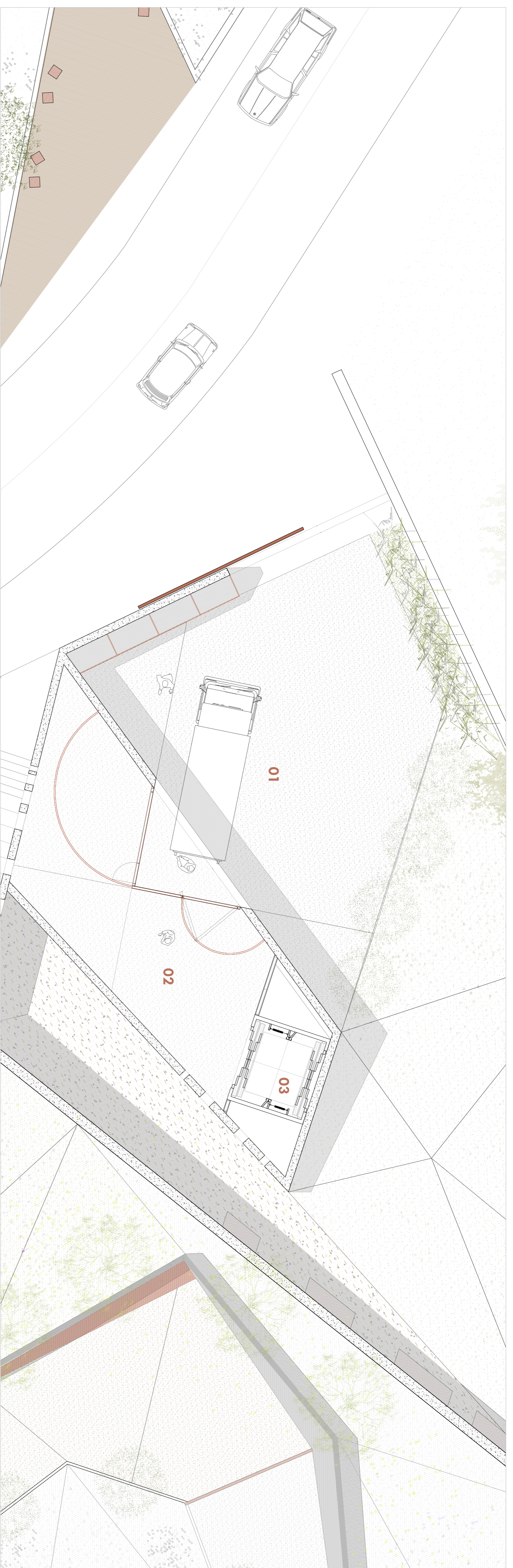
PLANTA COTA 87