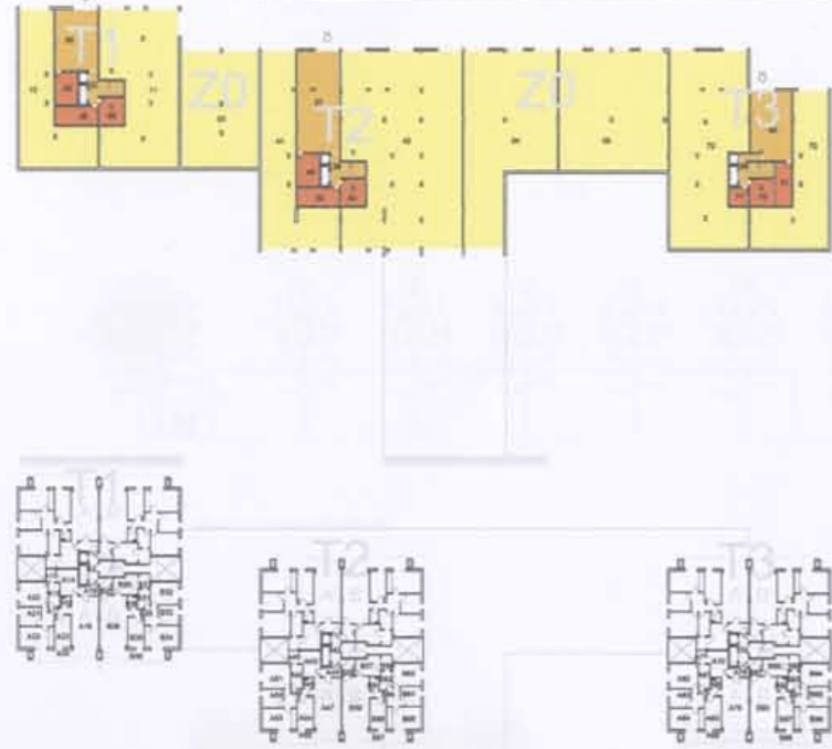
planta tipo e: 1/250