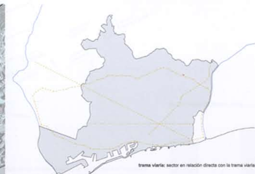
trama viaria: sector en relación directa con la trama viaria