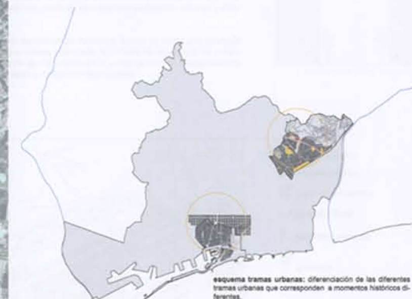
esquema tramas urbanas: diferenciación de las diferentes tramas urbanas que corresponden a momentos históricos diferentes.