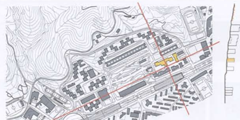
plano emplazamiento • 1:5000