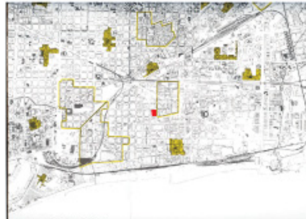
noves polaritats 1993