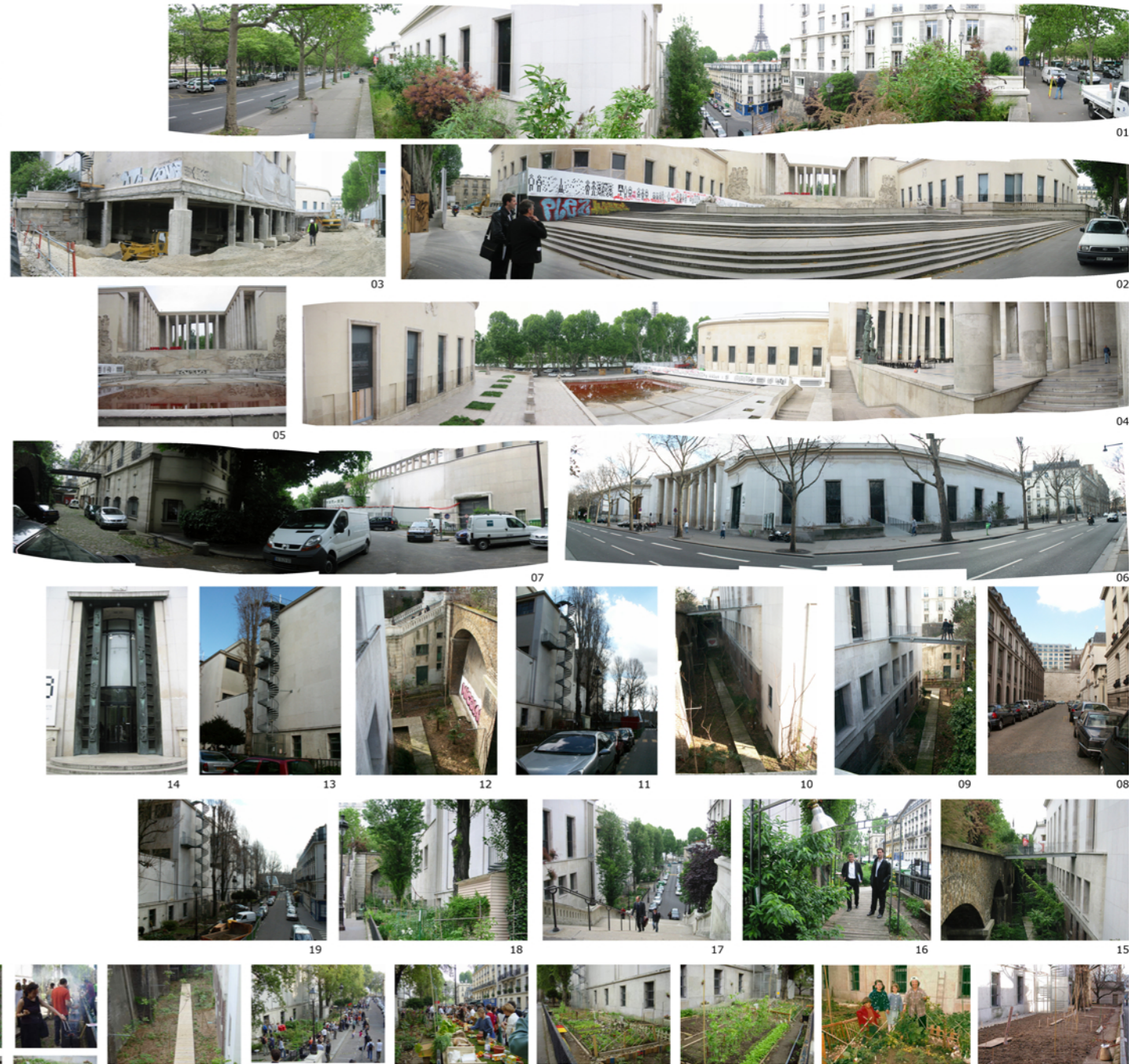
ACTIVIDADES SOCIALES REALIZADAS EN LOS JARDINES TRASEROS