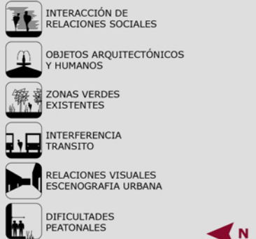
PLANTA GENERAL 1/1.000