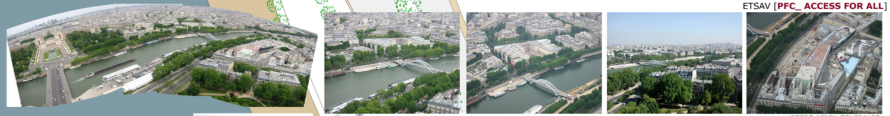
FOTOS AEREA GENERALES