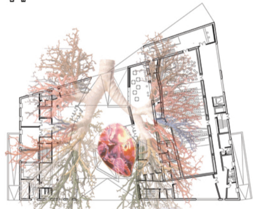
EL ESPACIO PUBLICO CENTRAL FUNCIONA COMO EL CORAZON QUE OXIGENA Y DA VIDA A LOS PULMONES QUE EN ESTE CASO SERIAN EL AUDITORIO Y EL CONSERVATORIO. E 1/500

CUBIERTA FOTOVOLTAICA * PROPORCIONA SOMBRA. * PROPORCIONA ELECTRICIDAD. * CUBRE LA PLAZA Y RECIBE EL AGUA DE LLUVIA PARA REAPROVECHARLA.