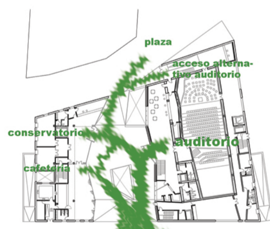
EL CORAZON DEL PROYECTO RECIBE LOS FLUJOS DE LA CALLE PRINCIPAL Y LOS REIRRECCIONA. E 1/500

TEJIDO PLURIFAMILIAR EN ALTURA TEJIDO DE GRAN ALTURA Y FACHADA PRESENTE EN LAS VIAS PRINCIPALES.