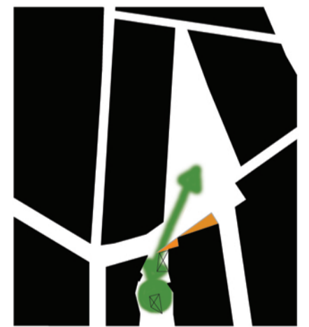
EL ESPACIO PUBLICO CENTRAL SE RELACIONA VISUALMENTE CON LA PLAZA PREVISTA EN EL PGO. SE CEDE PARTE DE LA PARCELA PARA MEJORAR ESA RELACION VISUAL Y ESPACIAL. E 1/1 250