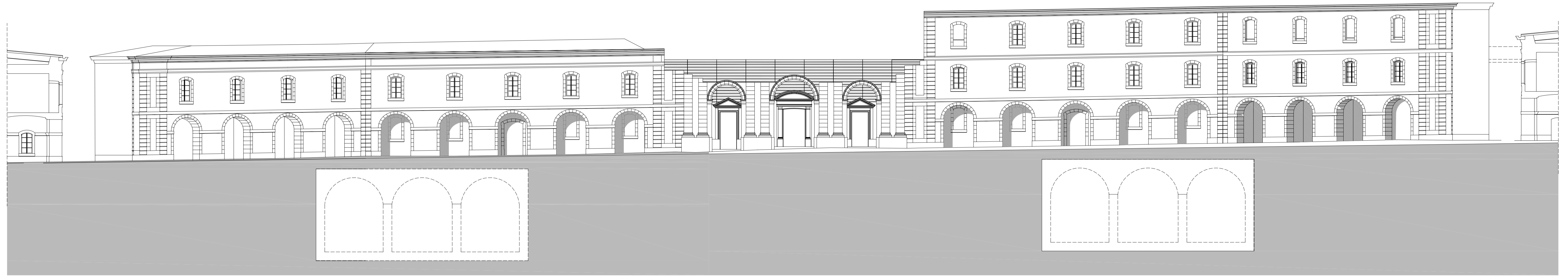
SECCIÓ TRANSVERSAL E-E'