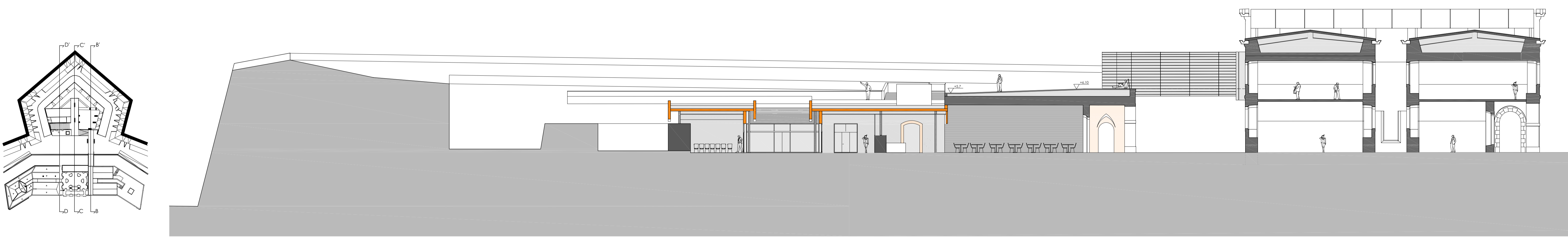
SECCIÓ TRANSVERSAL D-D'