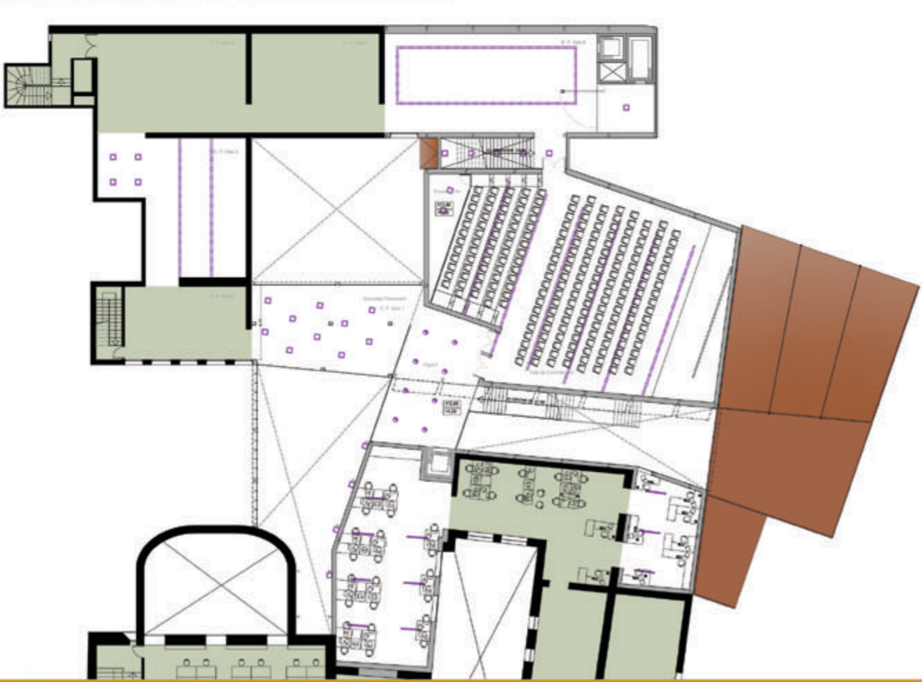
PROPOSTA D'IL·LUMINACIÓ A PLANTA PRIMERA