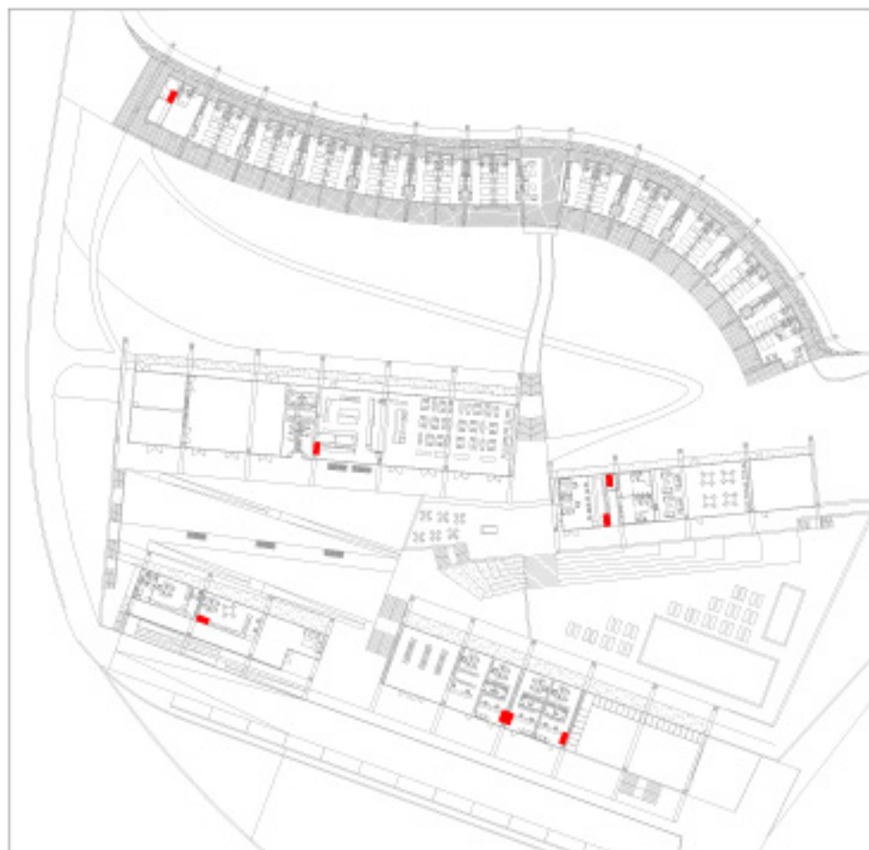
Localización de cuadros de distribución general y secundarios.