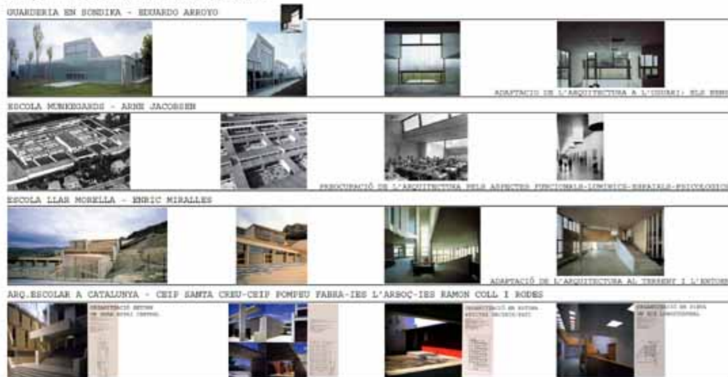
FOTO MAQUETA EMPLAÇAMENT