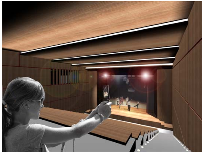
IMATGE SALA D'ACTES MULTIFUNCIONAL