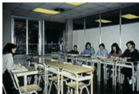
Figura I.3. Docència i formació