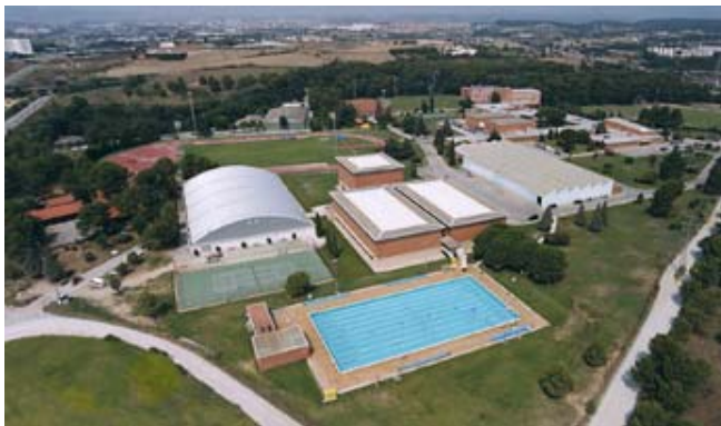
Figura I.1. Vista aèria del CAR

En aquest apartat es presenten algunes fotografies que mostren l'essència del CAR: