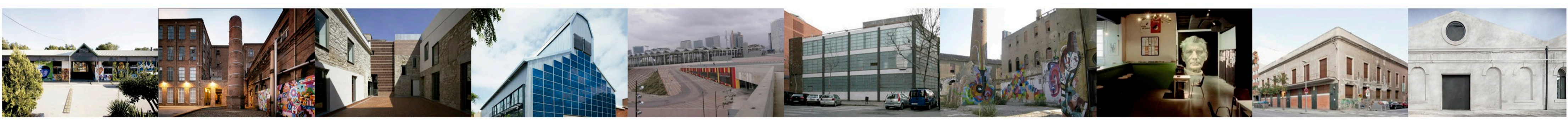
Sistema de equipamientos culturales (dramáticos, escénicos, musicales...) diferentes escalas