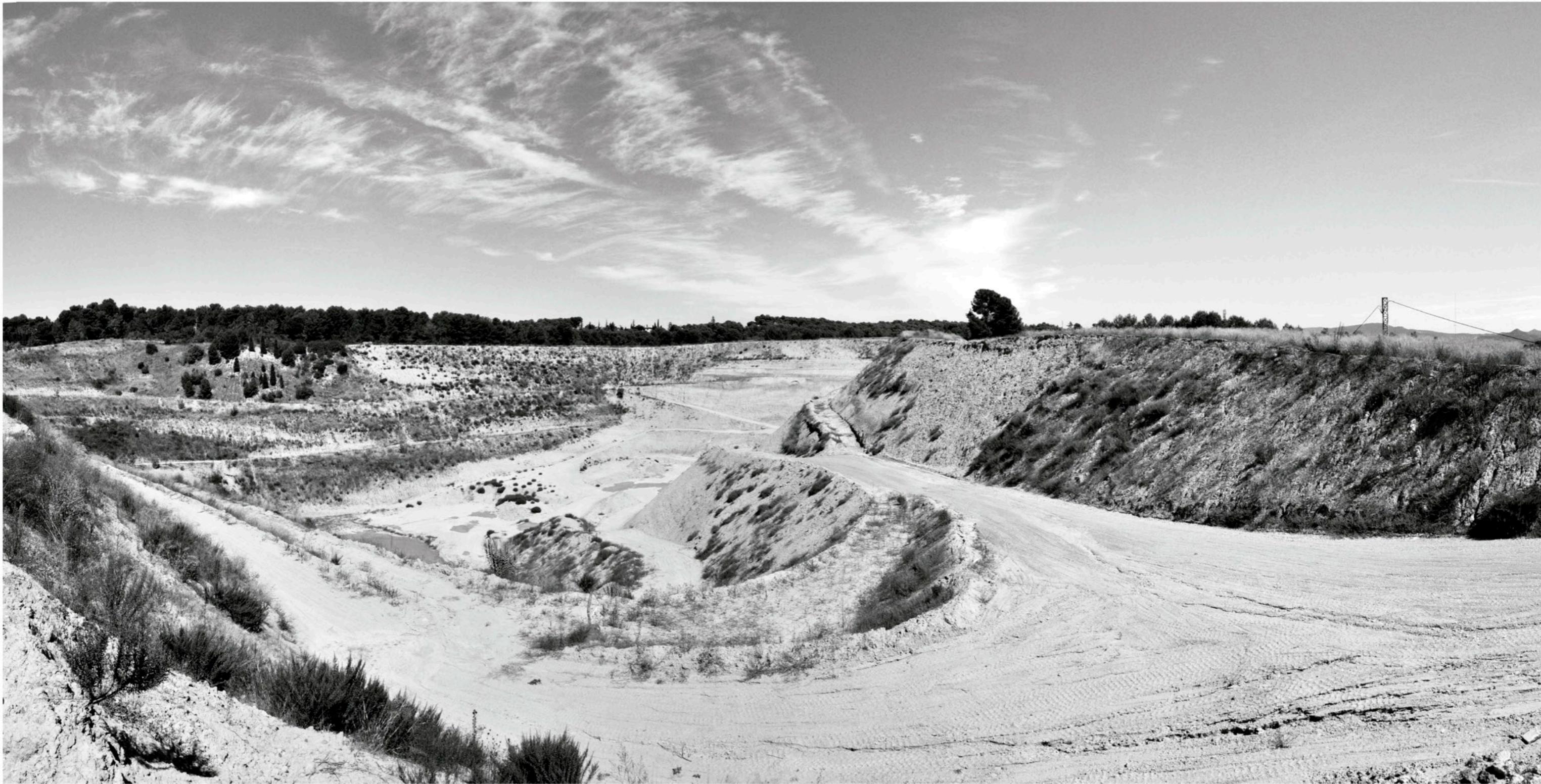
Cantera actual asociada a la fábrica ALMAR, en la actualidad está en desuso, anteriormente fue utilizada para conseguir la materia prima para fabricar los elementos de construcción que se vendían en la fábrica, actualmente es un nudo vacío y una desconexión en el terreno.