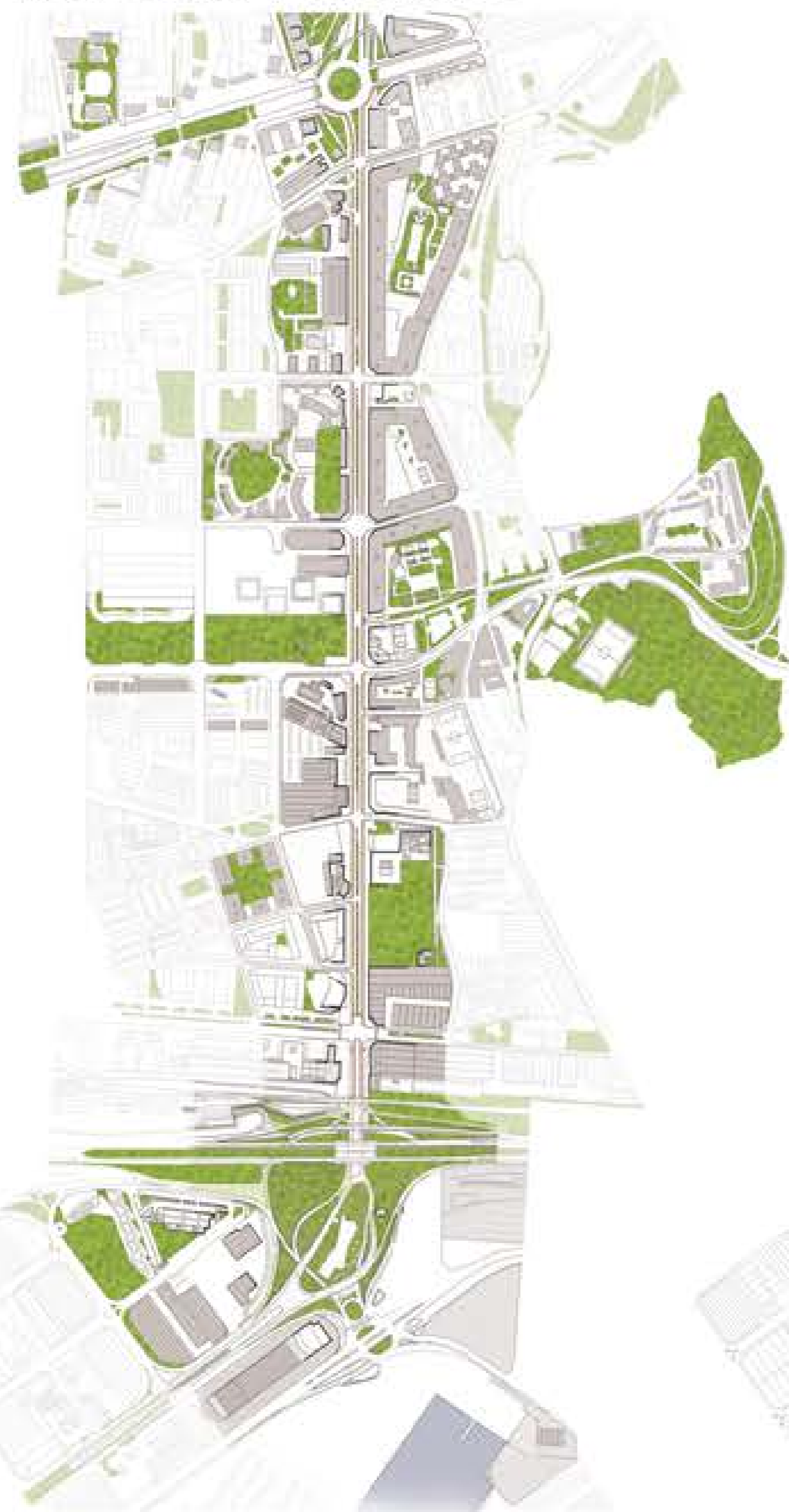
Espais lliures i d'oportunitat